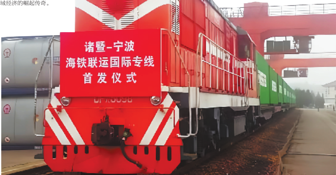
诸暨-宁波海铁联运国际专线