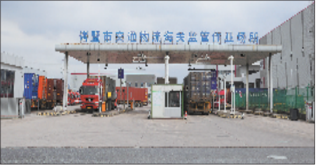
诸暨市海关监管作业场所

在长三角南翼的版图上，绍兴诸暨正以“大交通”战略为笔，在浙中大地描绘一幅“通江达海、辐射周边”的立体交通画卷。这座千年古城凭借区位优势与创新魄力，构建起公铁水空多式联运的现代化交通网络，不仅让“货畅其流”成为现实，更以交通枢纽之姿激活产业动能，书写区域经济协同发展新篇章。