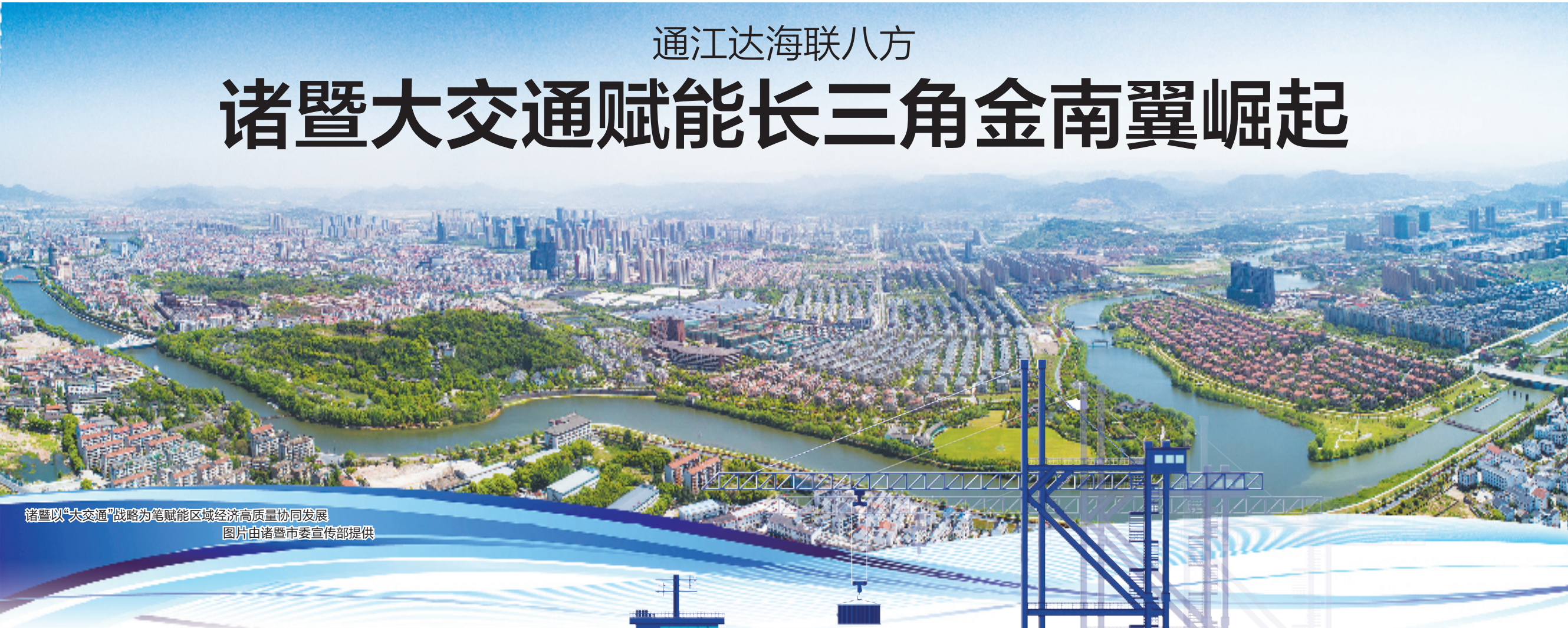
诸暨以“大交通”战略为笔赋能区域经济高质量发展

在长三角南翼的版图上，绍兴诸暨正以“大交通”战略为笔，在浙中大地描绘一幅“通江达海、辐射周边”的立体交通画卷。这座千年古城凭借区位优势与创新魄力，构建起公铁水空多式联运的现代化交通网络，不仅让“货畅其流”成为现实，更以交通枢纽之姿激活产业动能，书写区域经济协同发展新篇章。