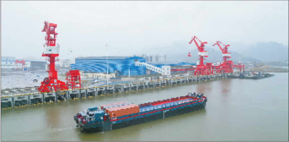
诸暨港区店口作业区待靠船船只