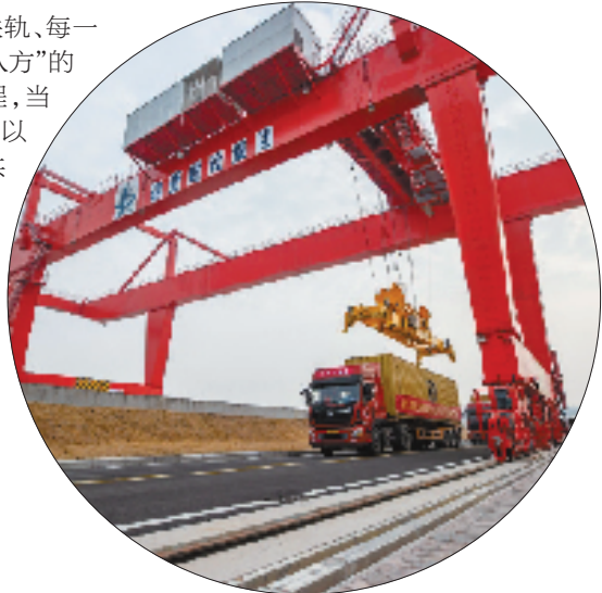
店口作业区作业现场

这里的每一段公路、每一节铁轨、每一米航道，都在诉说着“通江达海联八方”的雄心。当“义新欧”班列鸣笛启程，当64T集装箱船舶扬帆出海，诸暨正以“长三角南翼”的战略姿态，在共同富裕的道路上，驶向更加辽阔的未来。