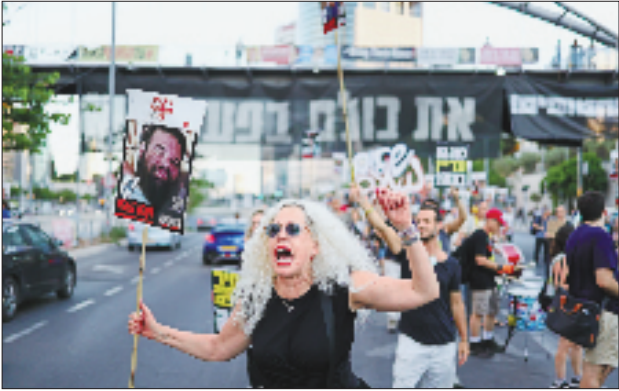
7月6日，以色列民众在特拉维夫举行集会，要求政府迅速在加沙地带实现永久停火，与巴勒斯坦伊斯兰抵抗运动(哈马斯)达成协议，让被扣押人员尽快获释。

新华社北京7月7日电 巴勒斯坦多名知情人士7日透露，巴勒斯坦伊斯兰抵抗运动(哈马斯)与以色列6日在卡塔尔首都多哈举行的新一轮间接谈判首日会谈无果而终。 巴方两名消息人士7日告诉路透社，谈判无果而终缘于以方谈判团队“未获得可达成协议的充分授权”。 新一轮谈判遇挫在会谈开启前就显露端倪。哈马斯先前与多个巴勒斯坦派别磋商后向斡旋方作出“积极”回应，但以方认为哈马斯提出的修改方案“令人无法接受”。不过，以方仍派出谈判团队前往卡塔尔参与谈判。 综合《以色列时报》、法新社等媒体报道，哈马斯坚持几大诉求，包括重开加沙地带南部拉法口岸，以向外运送伤员；要求停火方案阐明以军撤离加沙地带的时间表；敦促联合国主导的援助系统重回加沙地带。 上述要求遭以方拒绝。以色列总理本雅明·内塔尼亚胡6日称，以方将“摧毁哈马斯的军事和治理能力”，使其“不复存在”。 内塔尼亚胡6日动身赴美访问。他在启程前表示，期待与特朗普即将展开的会晤能够“推动”达成符合以方要求的停火协议。