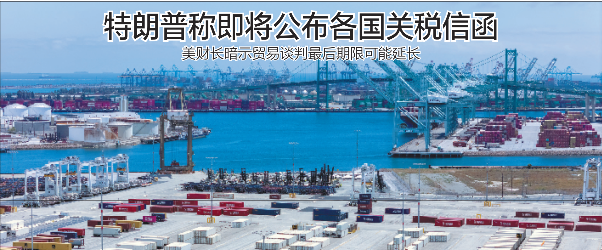
美国最大港口洛杉矶港负责人日前对媒体表示，受关税措施影响，该港口工作岗位近期已减少近半。这是5月13日拍摄的美国洛杉矶港(资料照片)。

与会国家领导人表示，金砖合作机制不断发展壮大，代表性进一步增强，国际影响力日益提升，为全球南方国家捍卫自身发展权利、维护国际公平正义、参与全球治理体系改革提供了重要平台。当今世界更加动荡，单边主义、保护主义抬头，金砖国家应加强团结协作，捍卫联合国宪章宗旨和原则，维护和践行多边主义，为推动共同发展、完善全球治理、促进世界持久和平繁荣作出更大贡献。 会议通过《金砖国家领导人第十七次会晤里约热内卢宣言》。