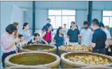
国际青年与小记者共同参与“开缸仪式”并学习传统腌制技艺。

如今，“大丰山”片区正以党建为引领之舵，以非遗为扬帆之力，承载着中华传统技艺穿越时空、跨越国界，在新时代的浪潮中焕发出蓬勃的全新活力，书写着文化赋能乡村振兴的精彩篇章。