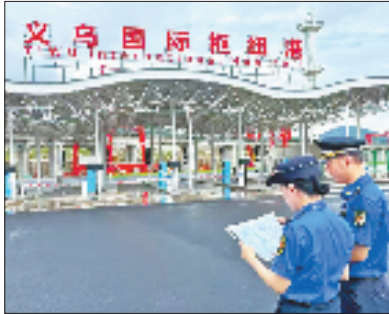
义乌国际枢纽港

在苏溪镇区，执法快速队从群众举报投诉到执法人员到达现场，时间不超过10分钟。“我们打破派出所、行政执法、市场监管、交通运输、城管等‘部门墙’，成立了一支执法快速队，满足辖区非警务事项的高效联合处置需要。”苏溪镇政府相关负责人说。今年以来，快速队处置事件6365起、处置率100%，群众满意率达98%。