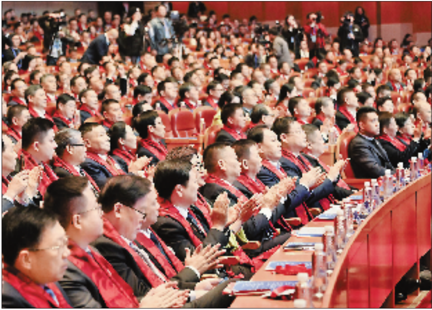
2024年11月28日上午,第七届世界浙商大会在杭州开幕。这是浙江省规模最大、规格最高、影响最广的浙商盛会,也是展现浙江民营经济强大韧性、蓬勃活力、独特魅力的重要舞台。

“平等”“公平”“同等”是条文中出现的高频词。立法坚持平等对待、公平竞争、同等保护、共同发展的原则,从公平竞争、投融资促进、科技创新、规范经营、服务保障、权益保护等方面,将我们党对民营企业使用资本、技术、知识等生产要素要加力支持的要求机制化,将促