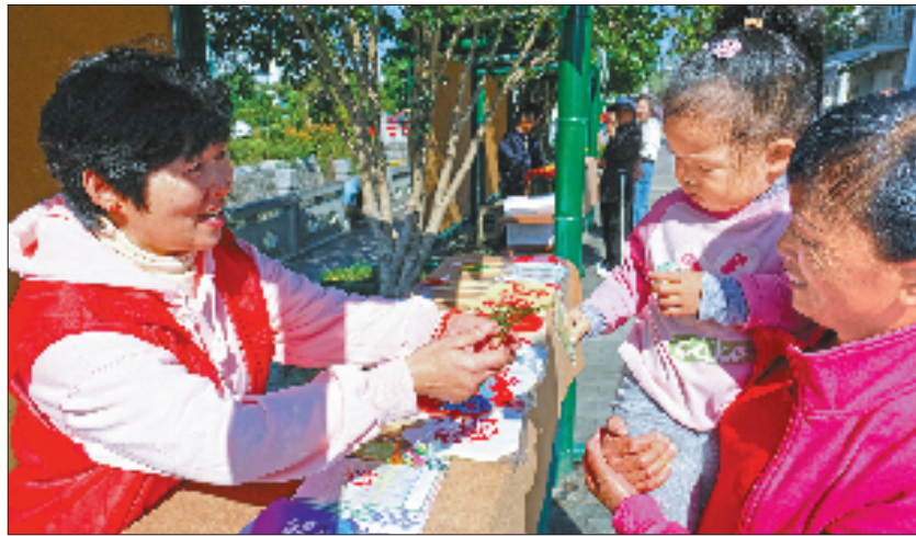
下杨未来乡村共富市集

今年5月，浙江公布《第二批省级中心镇名单》，双浦镇作为西湖区唯一代表上榜。对双浦而言，以省级中心镇