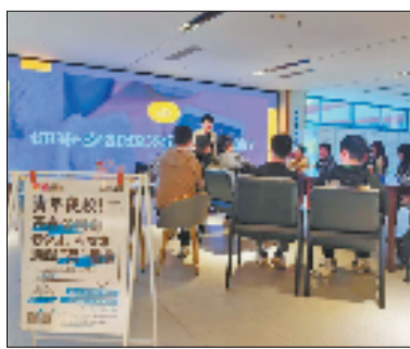
前江街道开设青年夜校

当前，前江辖区内有4万名左右的青年职工。“我们将继续为青年人才成长给政策、建机制、搭平台、精服务，支持他们在这里大施所能、大展才华、大显身手，助力前江打造新经济发展高地。”前江街道主要负责人表示。