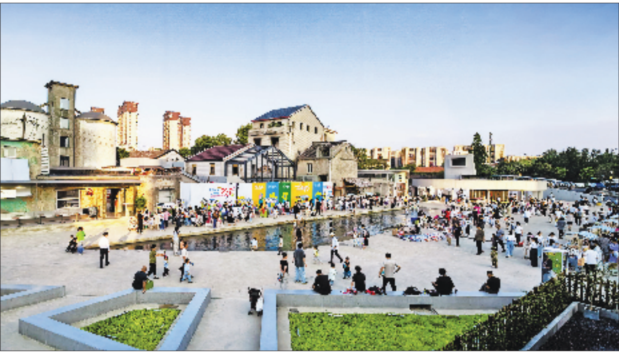
东巢·碾米厂当代艺术中心

在杭州,“工业遗存风”的园区不少。但东巢碾米厂在悉心呵护与改造下,不断“发芽”冒尖。园区开放前,西湖区投入上千万元,用于老建筑的保护与更新;交通不便怎么办?西湖区和三墩镇用时不到3个月,就将园区与主干道紫金港路之间的南阳坝巷修整贯通;园区开放后,各类生活 and 艺术活动成为“常态”,区镇两级不仅联动区内学校“生态圈”和“两镇六街区”文创资源,举行各类活动集聚人气,还为越来越热闹的园区做好安全防护、交通