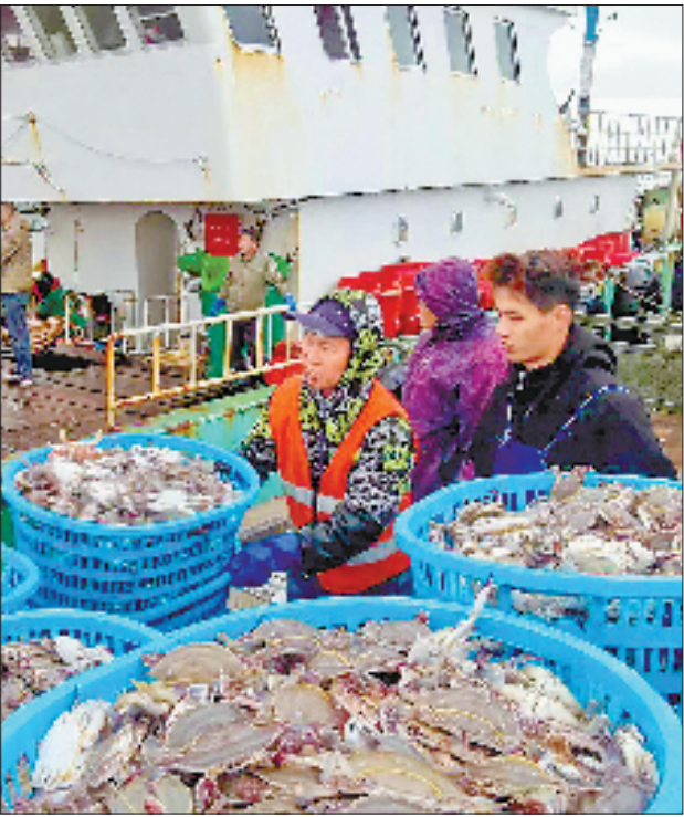
岱山蟹文化产业园码头,螃蟹装卸上岸(资料图)。

未来,现代化渔港不仅是一个交通枢纽,还是面向渔船、渔获和渔民的高效流转与舒适生活的综合服务平台。