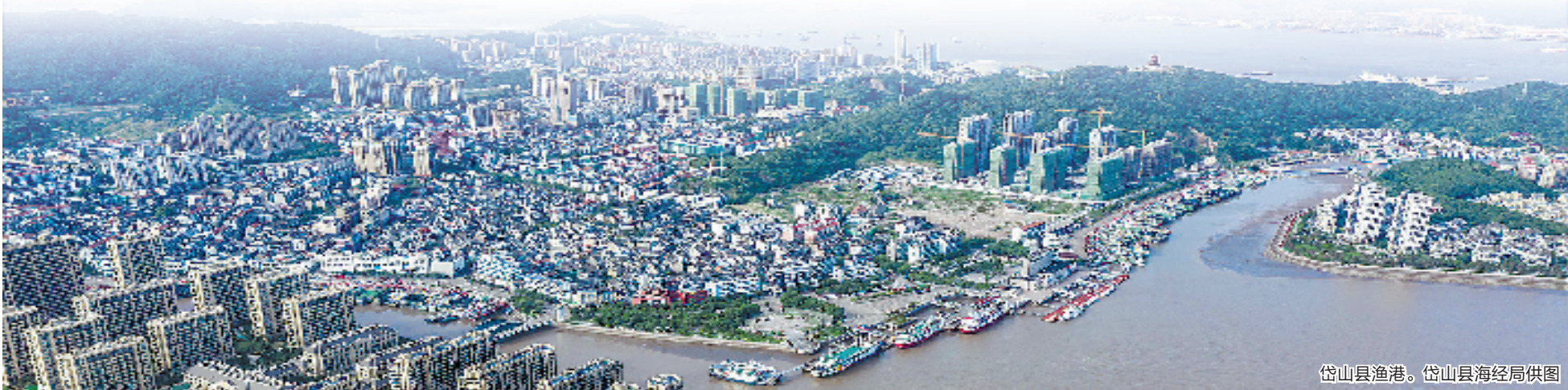
岱山县渔港。