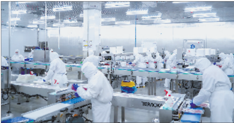
定海瞄准“远洋龙头、国际渔港”定位,引入多个金枪鱼加工项目。图为定海金枪鱼加工企业。

岱山有超过7500人从事梭子蟹生产,年捕捞量约为舟山的60%。形成鲜明反差的是,本地的梭子蟹交易量在试点建设前微乎其微。