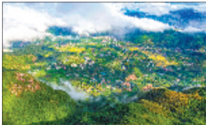
鸬鸟镇全域风景图