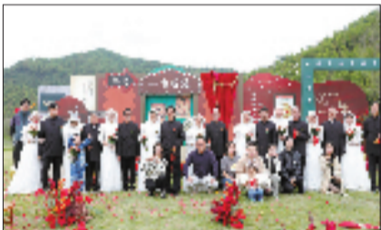
鸬鸟六礼之我为爸妈办婚礼

文明的鸬鸟，是处处彰显和美之韵的鸬鸟——新时代文明实践街区，串联起游客服务中心、文化礼堂等多个文明文化阵地，构建起“15分钟文明实践服务