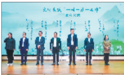
文明实践“一村一社一品”发布仪式

全国文明镇的荣誉，已成为鸬鸟全新的起点。未来的鸬鸟，文明是晨雾里的茶香、晚归时的路灯、孩子们追逐的笑颜，更是刻进骨子里的乡风民俗。一切关于“美好生活”的想象，在山水田园间，慢慢长成了触手可及的日常。