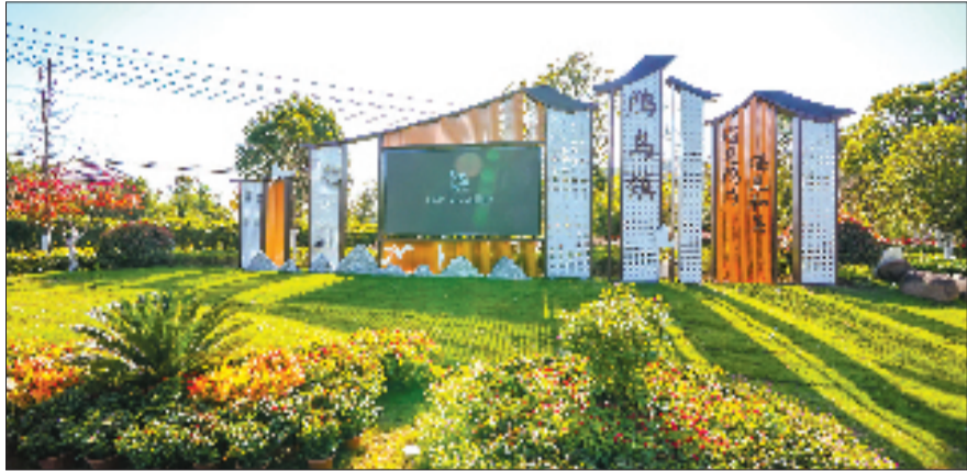
遇见鸬鸟 遇见和美

圈”。文明的鸬鸟，是有着规范化文明倡导条约的鸬鸟——出台余杭区内首部镇级《美丽公约》，开启“和和美家”行动，对覆盖全域3718户家庭的文明习惯、传统美德等实行“可视化”“积分化”激励；连续10年推选“美丽鸬鸟人”“和美志愿者”“和美好邻里”等典型，助力“榜样矩阵”不断扩容，让和美乡村的理念不断深入人心。