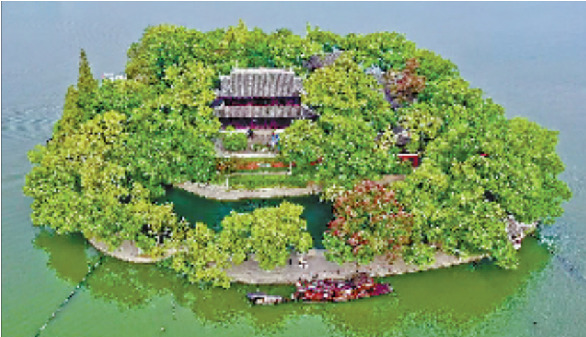
图为南湖湖心岛畔,红船静卧。

2006年6月28日,新馆动工,习近平同志亲自参加奠基仪式。他说,红船将如一座丰碑,永远伫立在南湖之滨,红船更是一种精神,永远铭刻在人们的心中。 历经5年建设,新馆落成开放。行走其间,复制的红船模型,带人