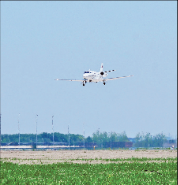
4月15日，校验飞机从嘉兴南湖机场上空飞过。