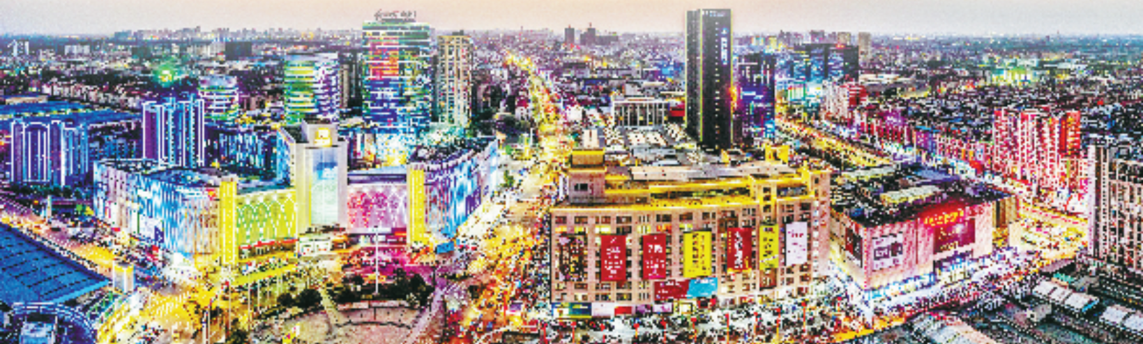
濮院羊毛衫市场核心区