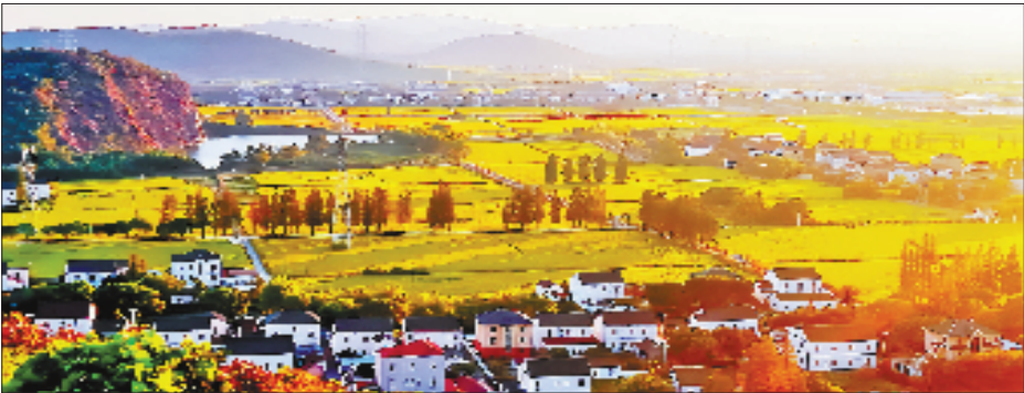
走进海盐县通元镇丰义村，感受夕阳下的“嘉”乡。