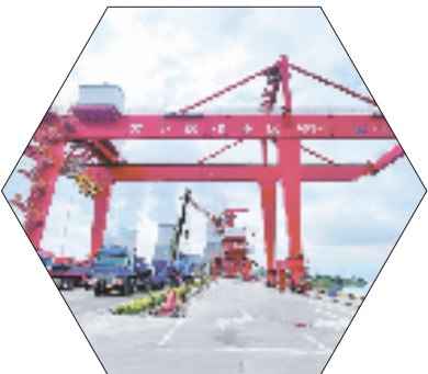
兰溪港方下店作业区

工程通车后,过境货车绕城通行,城区拥堵缓解20%,游埠、水亭、诸葛等乡镇(街道)到兰溪城区形成半小时交通圈。S314浦兰线改造、云山至马涧段提升工程等项目,通过完善兰溪市域“毛细血管”,从而促进城乡资源高效流动。 351国道、S314省道等骨干路网贯通南北,打造兰溪接轨长三角的“交通纽带”;建武高速、351国道续建等项目的推进,则将进一步拉近兰溪与金华、杭州等城市的时空距离,为兰溪经济发展注入强劲动能。