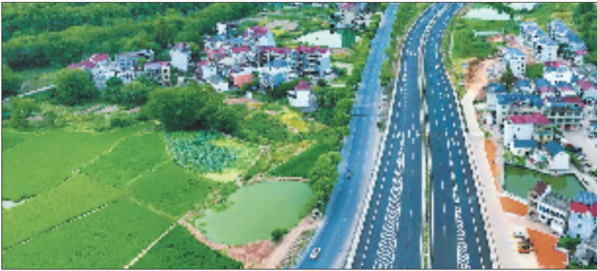
兰溪 G330 国道改建工程通车

已经是兰溪杨梅产业发展的重要方向。在原马涧镇天马纺织厂旧址,兰溪市交投集团聚焦绿色生态经济转化,首创推进马涧GEP项目,投资2.5亿元规划实施杨梅深加工产业园项目,引入专业运营、销售及投资团队,打通“产、供、销”全链条,投产后,更以“家门口就业”模式让梅农实现“树上摘果、厂里增收”的双重效益,这颗小红果将成为富民强村的“黄金果”。 兰溪农业领域缺乏龙头企业,兰溪交投集团在兰溪市农业农村局的指导下,根据实际,扬长补短,依托自有农业发展公司,聚焦土地整治、种子培育、农产种植、生猪养殖、深度加工、物流配送、线上销售等各个环节,构建现代化农业产业链。杨梅深加工产业园就是杨梅产业化升级的典型项目。 除了围绕兰溪六大地标农特产品发力,兰溪交投集团还聚焦畜牧养殖产业链条延伸,在梅江镇青山绿水间,谋划885亩的兰溪花猪种质资源保护项目。该项目规划建设保种与育种双核心群生产线,保育600头本土基础母猪及50头优质种公猪,配套现代化保育舍、育成舍,形成出栏纯种花猪0.4万头、商品猪4万头的规模。该项目既筑牢了本土猪种“基因库”,又保障市场优质肉品供给,以“保种+育种+生态”三链融合打造现代农业新范式。 据悉,该项目计划于今年底开工,预计能带动周边农户年均增收超万元,助力兰溪传统养殖升级为“生态养殖+绿色种植”双轮驱动的现代农业。