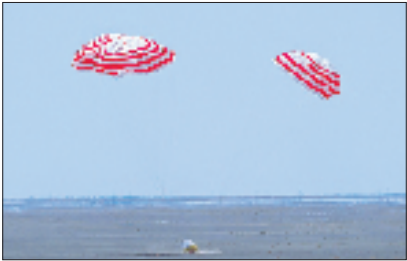
6月17日,我国在酒泉卫星发射中心成功组织实施梦舟载人飞船零高度逃逸飞行试验。

要的安全保障手段,发生紧急故障时,能将载有航天员的飞船返回舱带离危险区域,并确保航天员安全返回地面。梦舟载人飞船是我国面向后续载人航天任务完全自主研发的新一代载人天地往返运输飞行器,飞船自身采用模块化设计,可搭载最多7名航天员,整船性能达到国际先进水平。 梦舟载人飞船未来将成为支撑空间站应用与发展、载人月球探测等任务的核心载人飞行器,这次试验成功为后续载人月球探测任务奠定了重要技术基础。此外,执行载人月球探测任务的长征十号运载火箭、月面着陆器等航天器研制工作正在扎实稳步推进,后续也将按计划组织实施相关试验。