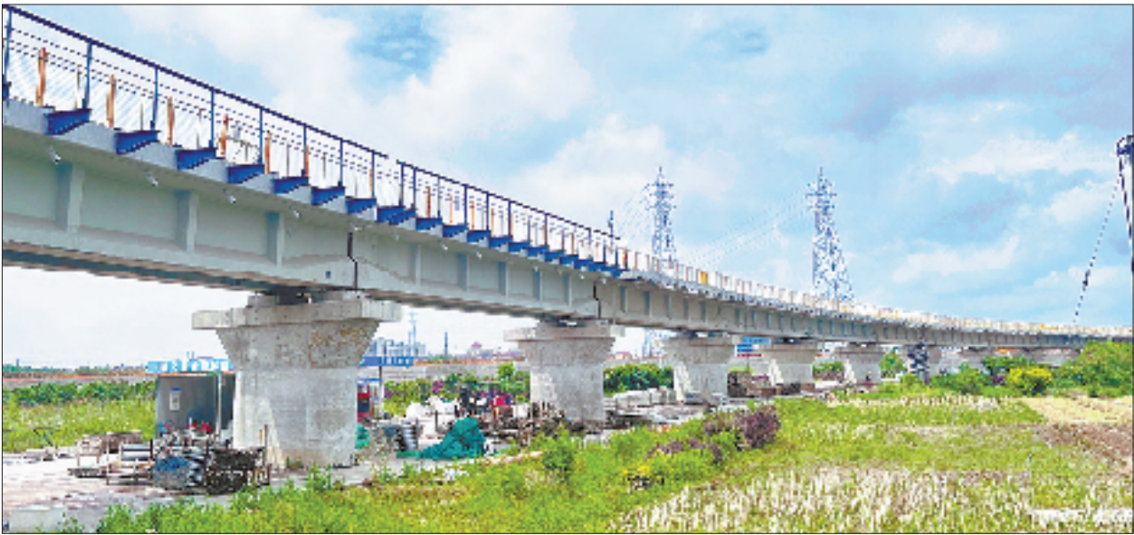
建设中的兰溪铁公水码头铁路专用线

“日对千舟竞发,夜观万户明灯”,金华市兰溪横山上,灵源积庆侯庙前檐柱上的对联,生动描绘了兰溪繁华景象。 兰溪自古有“三江交汇”“六水之腰”“七省通衢”之称。今年是浙江高质量发展建设共同富裕示范区的关键之年,兰溪交投集团发挥得天独厚的交通区位优势,不断完善水路交通网,精准赋能兰溪产业发展。兰溪交投集团以“一子落”带动“满盘活”,织路成网连接城乡,通江达海“链”通全球,深耕沃野发展现代农业,将基础设施建设与产业升级、民生改善深度融合,以“红色引擎”驱动探索“党建引领、多域联动”的三位一体共富新路径。