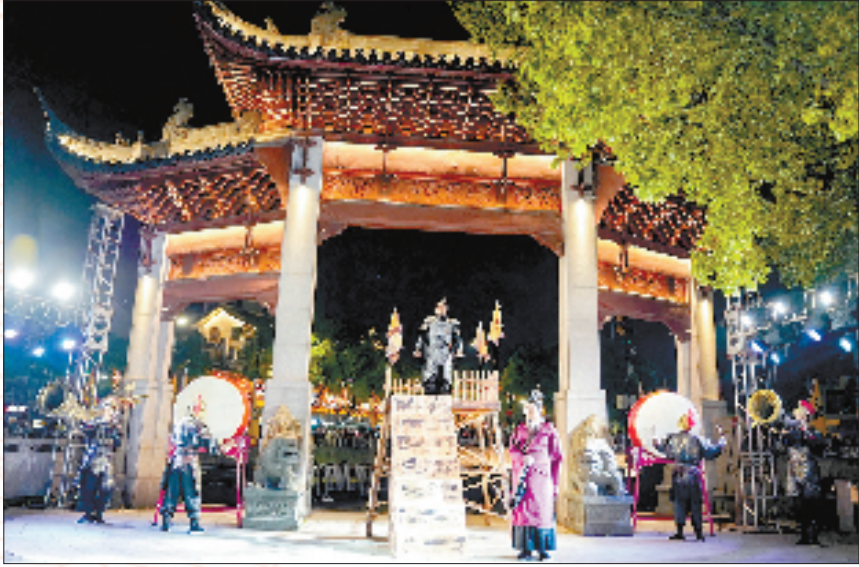
《一越千年·古韵长歌》大型沉浸式夜间演艺

越城越来越有戏了，这是许多市民和游客近两年的感受。早在去年7月，古城投繯河畔就连续两日上演“梦回越王簪繯劳师秀”，现场全员参与互动，穿越在“出征伐吴”的历史场景中。这场古老传说的“活化”演绎，共吸引3.8万人次现场围观，98万人次观看了直播，为古城积累了一波夜流量。 让场秀秀串起古城特色街区、人文