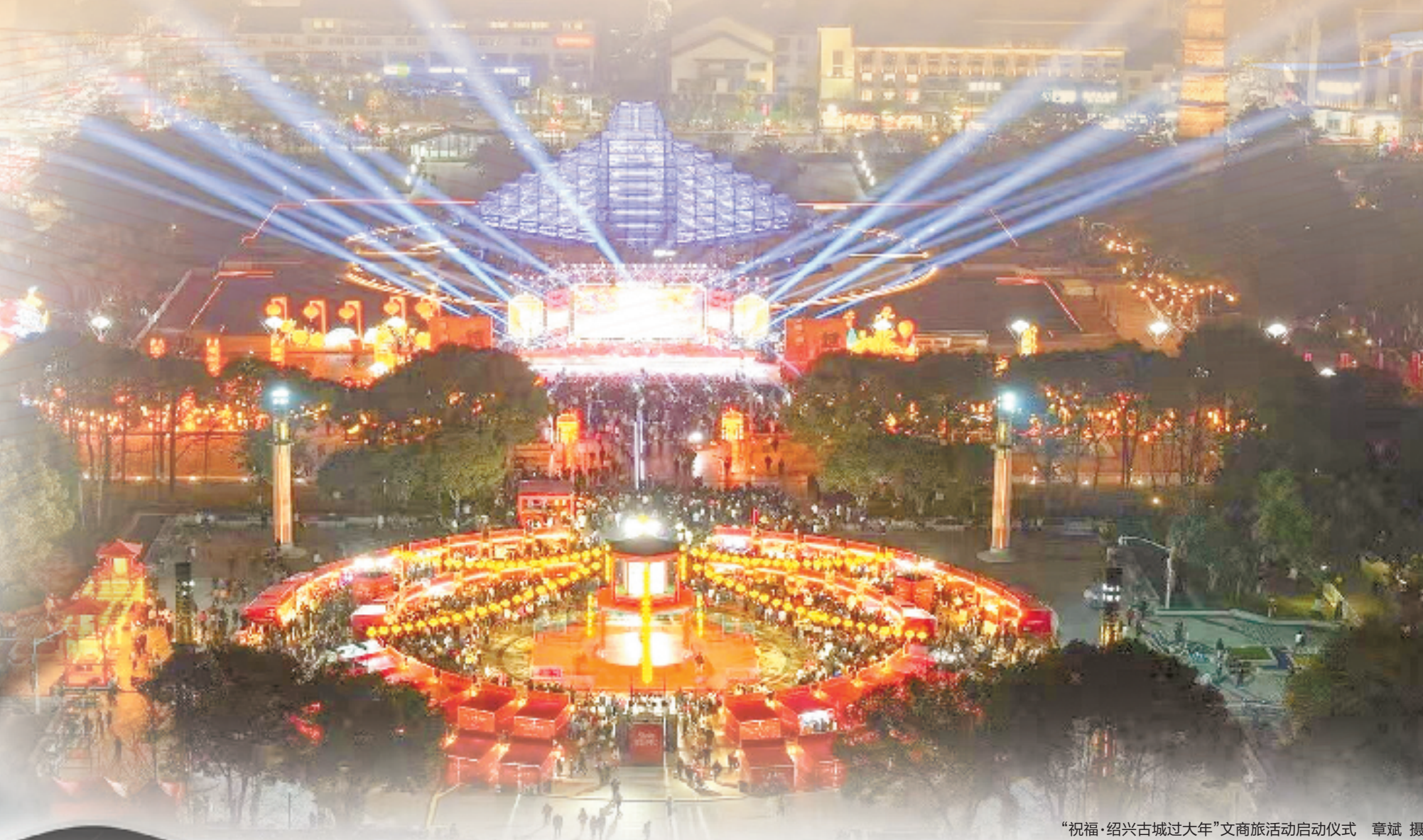
“祝福·绍兴古城过大年”文商旅活动启动仪式

夜色点亮了古老的浙东运河。与河共生的千年古城，悄然褪去白日的匆忙，换上一身亦闹亦静的外衣。 华灯初上，绍兴越城区开始展现不同的一面：街区热闹起来了，酒吧、茶馆迎来各地客人，演绎队伍穿梭其间；商圈热闹起来了，餐厅、秀场人气火爆，各式活动点燃全场；景区热闹起来了，袅袅越音唱出水乡韵律，说书场上细品越国风姿。 唤醒城市的夜间魅力，是越城区近年来的发展小目标。2024年，该区夜间消费总额突破80亿元，同比增长6.8%，区域夜间消费对经济增长贡献率达37.8%；全年共接待游客1669.2万人次，过夜游客745.6万人次，占比44.6%，同比增长21.4%。今年上半年的各个小长假，夜游数据也全面刷新，创下新高。 大力提振消费，以高质量供给创造有效需求，以优化消费环境增强消费意愿，是当前促进国内经济发展的有效抓手。将“首位立区、幸福越城”作为发展方向的古城，正以产城人文融合发展为目标，全方面、各领域创新形式、协同突破，让越城“越夜越精彩”。