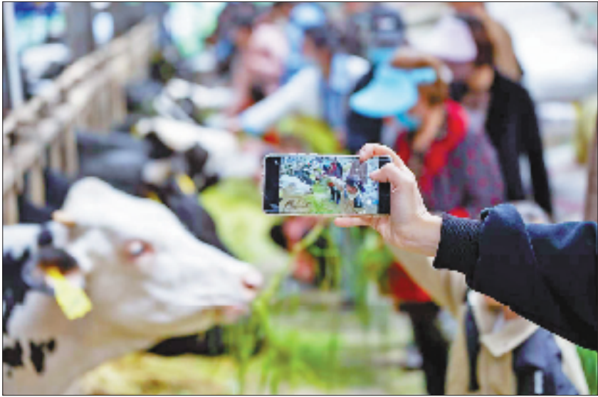
牛花花小镇东兴奶牛场

如今,在全新的城乡发展轴上,王店镇迎来了重塑城乡格局的“黄金时期”。“上榜省级中心镇,对于我们来说是新的起点,也是新的机遇。”王店镇相关负责人说,未来,王店镇将继续发挥中心镇的示范引领作用,为推动城乡融合发展、缩小区域差距作出更大贡献。