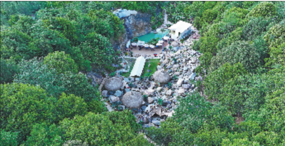
俯瞰“乱石咖啡”园区,曾经的废弃采石场变身网红打卡地。