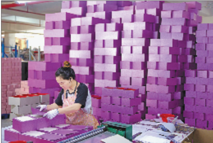
工厂员工各司其职赶制出口礼品盒订单。