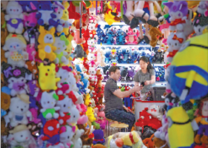
外商在义乌国际商贸城圣诞店铺选购产品。