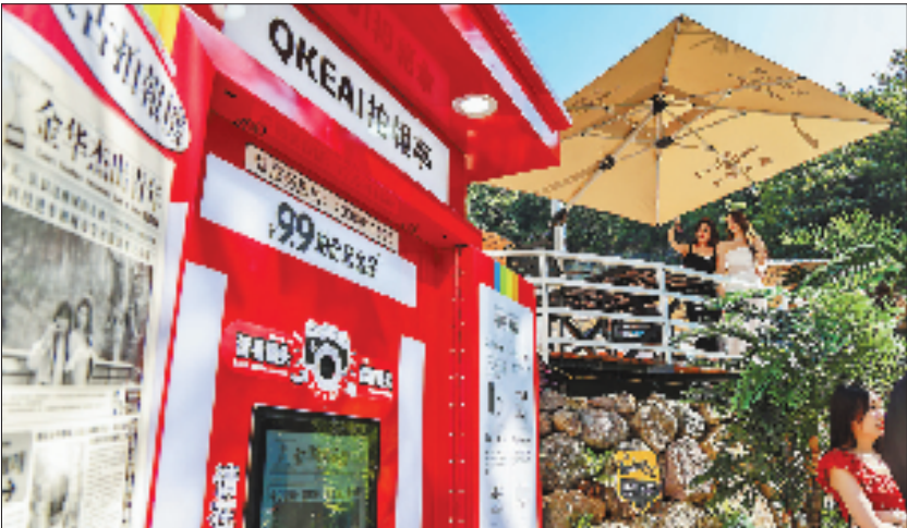
园区内,复古拍报亭与用乱石垒砌的休憩平台成为游客争相取景的驻足点。