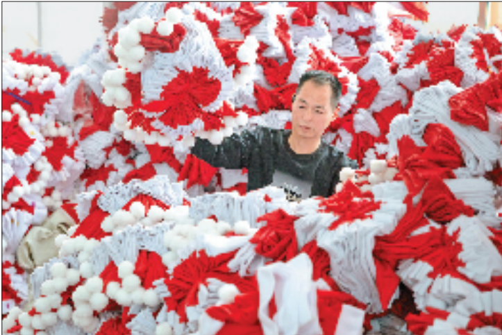
堆积如山的圣诞帽,即将出口至南美。