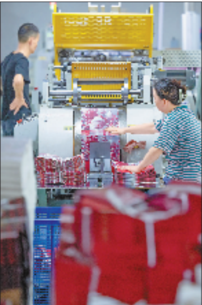
在自动化机器的高效运作下,圣诞礼品袋生产效率明显提升。

义乌凭借着完善的产业配套、高效的生产能力以及极具竞争力的价格,早已成为全球圣诞用品的重要供应基地。