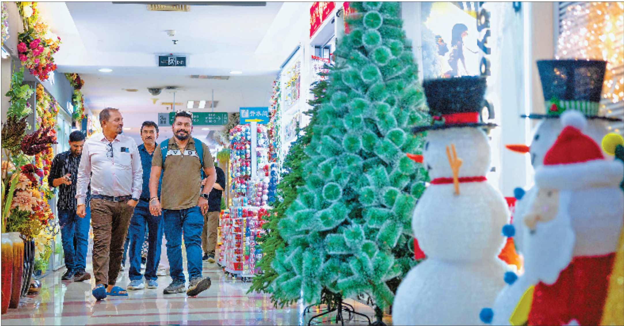
商贸城圣诞用品区,外商被琳琅满目的圣诞产品吸引。