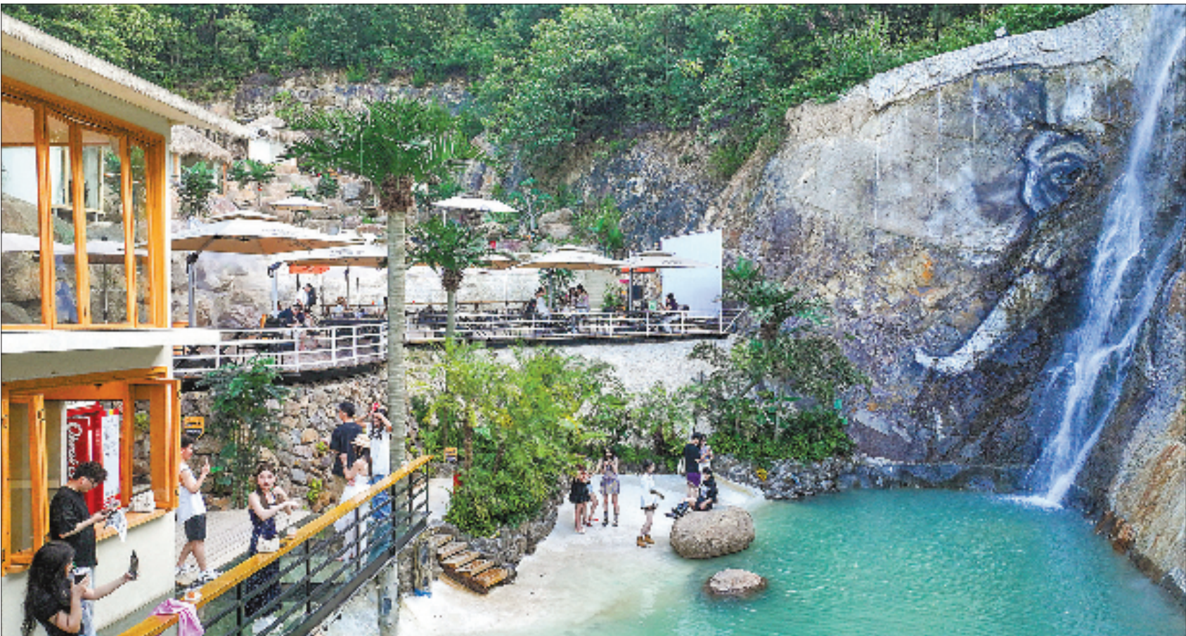
园区吸引了众多年轻游客前来打卡游玩,尽享自然野趣与闲适氛围。