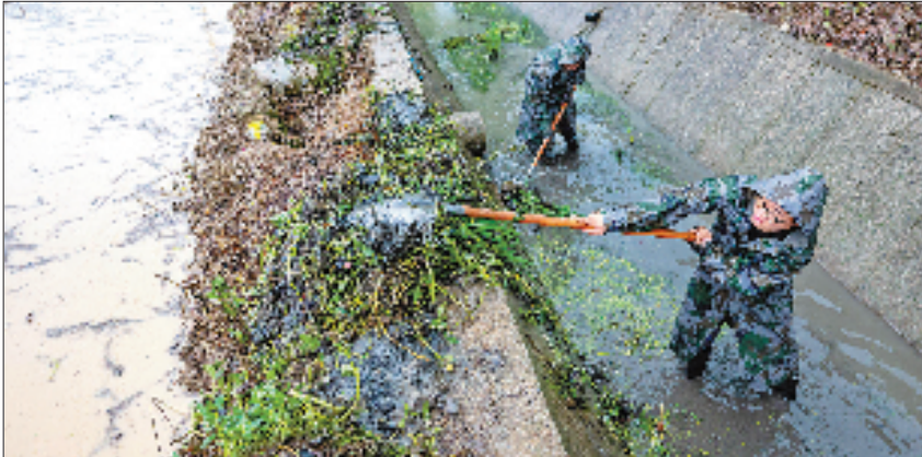
6月11日，长兴县小浦镇中山村，青年党员在清理农田排水沟内的水草杂物，加速积水排放。