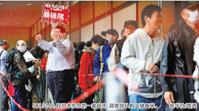
5月31日,在日本东京的一家超市,顾客排队购买储备米。