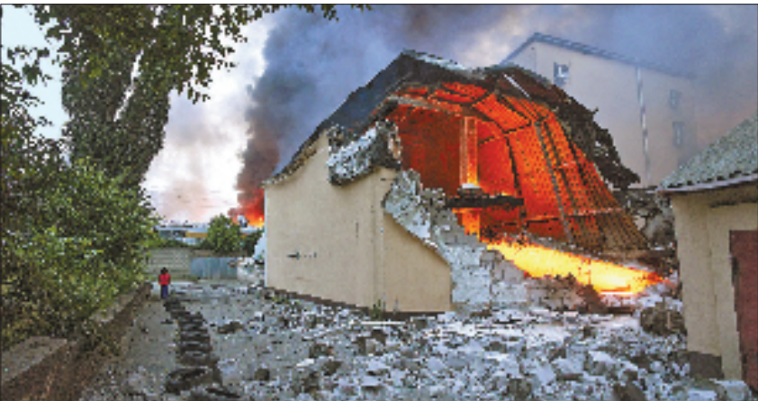
当地时间6月10日,乌克兰基辅,俄罗斯导弹和无人机袭击后,受损建筑上空浓烟滚滚。