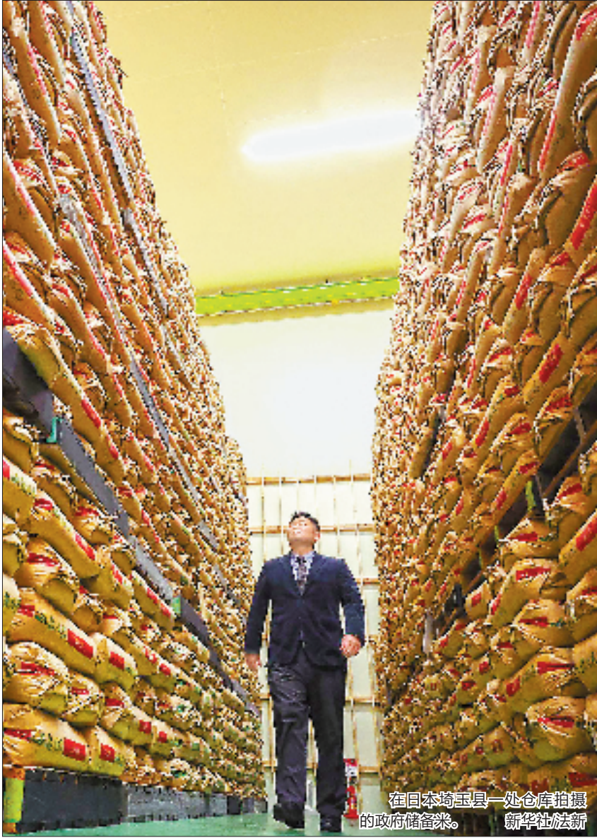
在日本埼玉县一处仓库拍摄的政府储备米。

今年2月,日本政府决定向市场投放储备米,3月拍卖首批15万吨储备米。但不少日本专家批评政府反应滞后,丧失了抑制米价的最佳时机。