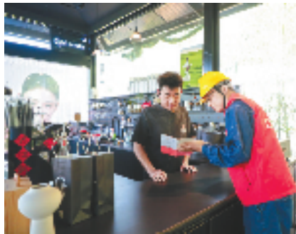
国网绍兴供电公司工作人员向“管溪里·村咖”主理人讲解安全用电知识，分析用电情况。

电力是村咖发展的基础保障，更是撬动乡村产业转型升级的关键支点。这场优质供电服务成功助力山水资源转化为蓬勃的“美丽经济”，生动书写了“绿水青山”通向“金山银山”的上虞实践样本。展望未来，国网绍兴供电公司将持续深化“村网共建”，优化服务流程，提升响应速度，以更可靠稳定的供电质量和更智能贴心的用电服务体系，为乡村振兴和农文旅融合的高质量发展持续注入澎湃电力动能。