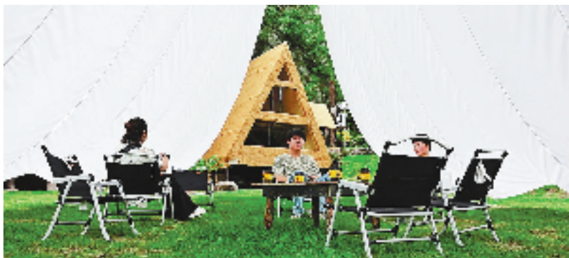
游客打卡“嘿咖氧吧”的星空露营地

“‘嘿咖氧吧’的实践，是镇里探索闲置资源盘活、村集体增收、村民就业三方共赢的重要突破。”茆道镇相关负责人说，项目通过市场化运作将沉睡的生态资源转化为优质文旅产品，既保留了乡村原生风貌，又注入了青年创业活力，为山区村域经济发展提供了可复制的“青年创业+生态变现”转化范本。随着“一村一IP”全域文旅战略的推进，当地正以点带面推动更多乡村实现从“美丽资源”向“美丽经济”的跃升。