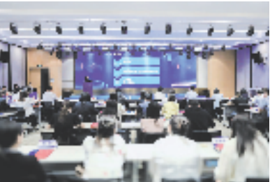
杭州未来科技城开展政策推介会

奋力推动数字经济再攀高峰,杭州未来科技城要为余杭区打造杭州城市重要新中心作出新的更大贡献。