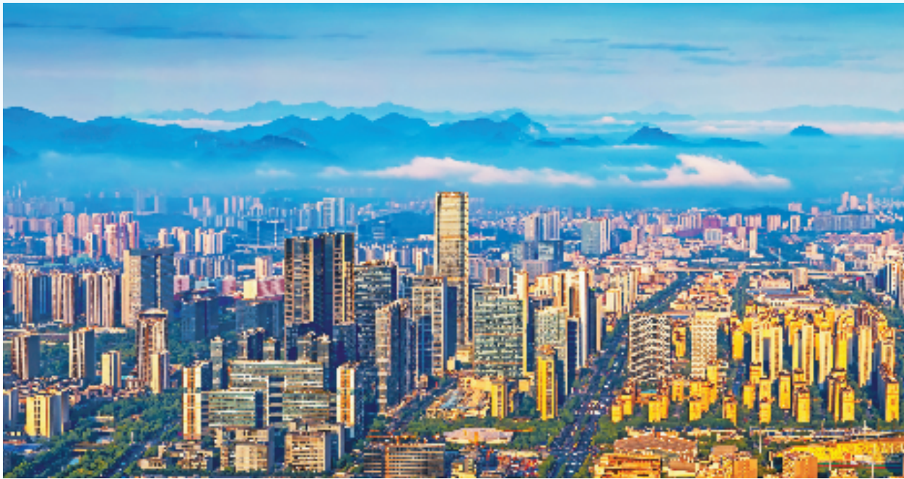
俯瞰杭州未来科技城

脊髓上的信号传导比作高速公路,脊髓损伤就像高速公路遭到破坏,导致大部分车道无法通行。“我们植入的产品好比是修复受损道路,重新增强车辆通行能力”。