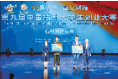
第九届中国杭州大学生创业大赛杭州赛区决赛现场

“这场大赛不仅仅是一场比赛,更是一座城市与青年创业者的双向奔赴。”钱塘新区管委会相关负责人说,