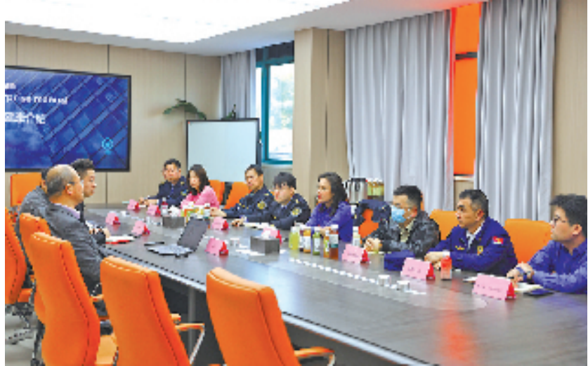
德清县综合行政执法局联合多部门为企业提供“预约式”指导服务。

美丽环境离不开德清县综合行政执法局治理工作的精益求精。近年来，该局秉承“以最江南的生活美学增进德清山水韵味”理念，全面开展“奋力推进都市德清建设 打造最洁净城市1416行动”。去年一年间，该局通过开展扬尘整治、监管餐饮油烟、严抓露天焚烧等举措，查处治气领域案件769起；打出垃圾分类“636”智慧化示范建设、农