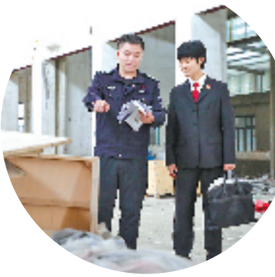
德清县人民法院执行法官到厂房现场查看并清点相关物资。

“感谢法院，厂区腾干净了，我心里的石头终于落地了……”今年3月，德清县一家商贸公司的负责人小刘从德清县人民法院执行法官手里接过厂区钥匙，连声道谢。