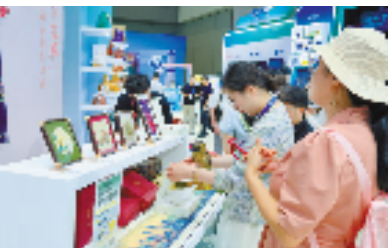
纺织非遗文创产品受到消费者青睐

据悉，海宁中纺面料科技有限公司、海宁天龙布业有限责任公司、海宁市金涛丝绸布艺有限公司3家本土文化企业携织锦、漳缎等非遗技艺与文创产品，呈现了一场传统与现代交融的文化盛宴。