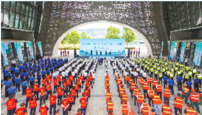
“奋力推进都市德清建设 打造最洁净城市1416行动”出征仪式

当前，针对“室外公共场所无照经营”等5类案情简单、违法事实清楚、证据充分、社会影响小的普通程序案件，德清县综合行政执法局的执法队员利用“简案快办”程序，迅速完成现场取证、询问、记录等工作，最快可于当天制发《行政处罚决定书》。当事人通过二维码缴纳罚款后自动结案，实现“简单案件当日立案、当日结案”的高效流程。2025年以来，该局共办结“简案快办”44件，类案平均办结时间缩短了20天。