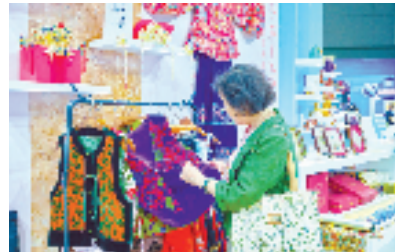
海宁许村展区

截至目前，许村展会收获超百万元意向订单。“从家纺到高定，从代工到品牌，许村正在重写‘中国制造’的定义。”许村镇相关负责人表示，“这两年因为马面裙的出圈，让大家知道了海宁许村，我们也抓住了这次机遇，将传统纺织与时尚产业相结合，促进传统纺织行业的转型。”接下来，许村镇也将以“文化+科技”赋能海宁许村国际时尚中心，使其成为海宁许村家纺新的底稿。