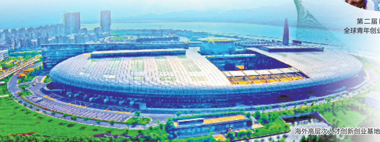
海外高层次人才创新创业基地