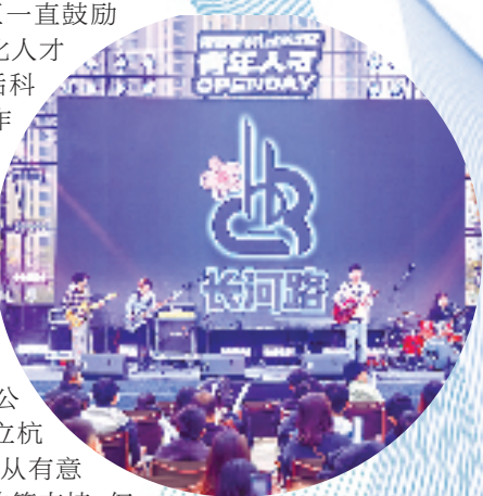
“人才四季”系列活动