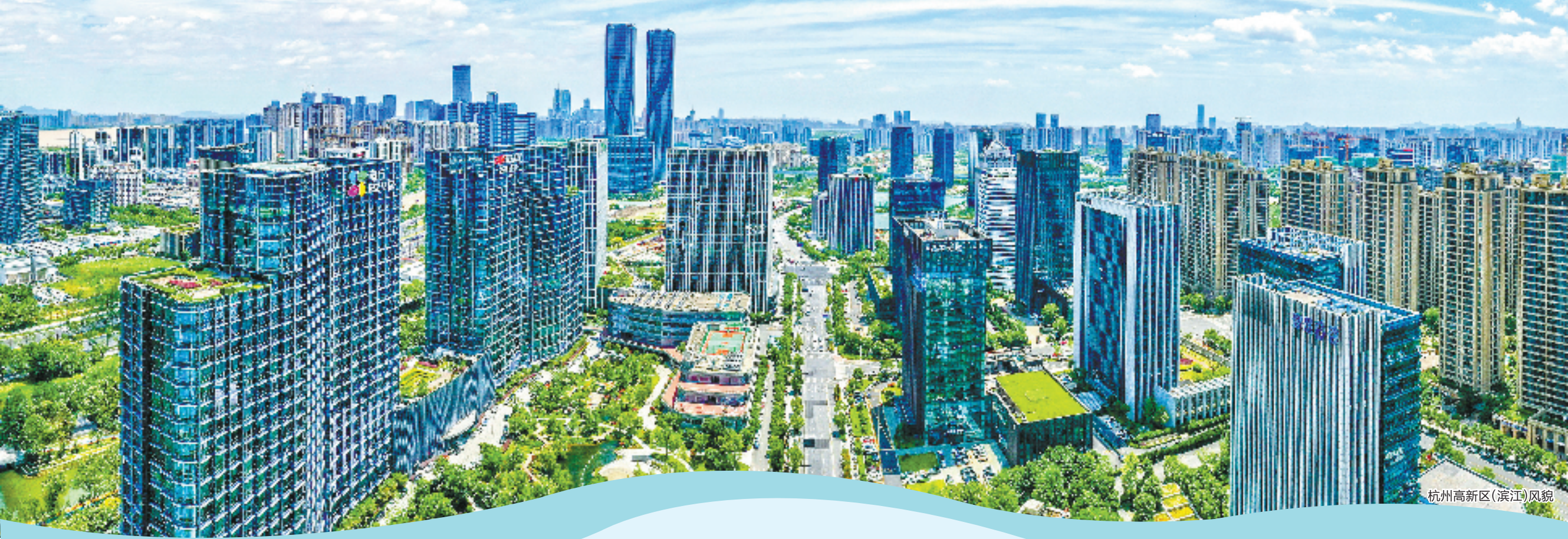
杭州高新区(滨江)风貌

2015年以来,该区新引进人才超33万人,人才总量突破49万人,引才量、人才总量多年居省市前列。