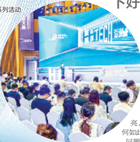
第二届HI TECH全球青年创业大赛