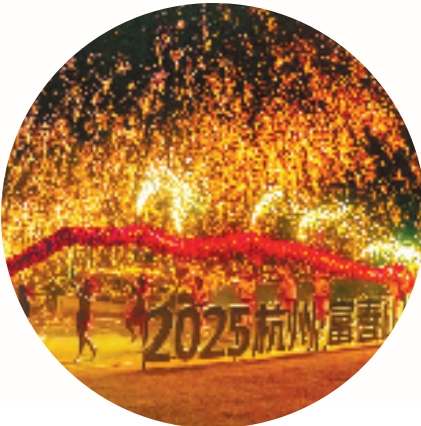
2025富春山居图潮灯会

例如秦望区域,在江南,与隧道连接的秦望南路同步开通,全长1.98千米,成为富春湾新城的城市主干道;在江北,富阳的商业新地标——秦望水街已初露真容,正抓紧建设。这条全长430米、建筑