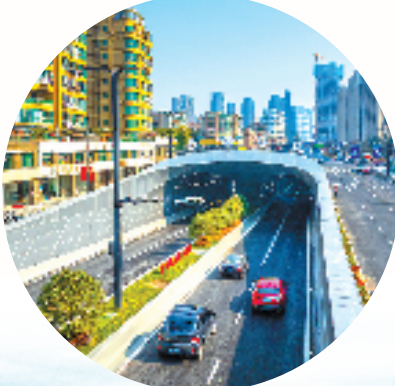
秦望隧道

经过约3分钟的“畅通无阻”,汽车通过秦望隧道,从富春江下穿行而过。该隧道是浙江省重点建设项目,总投资约78亿元,连接秦望路与金桥南路,全长2868米,今年1月正式通车,对连通