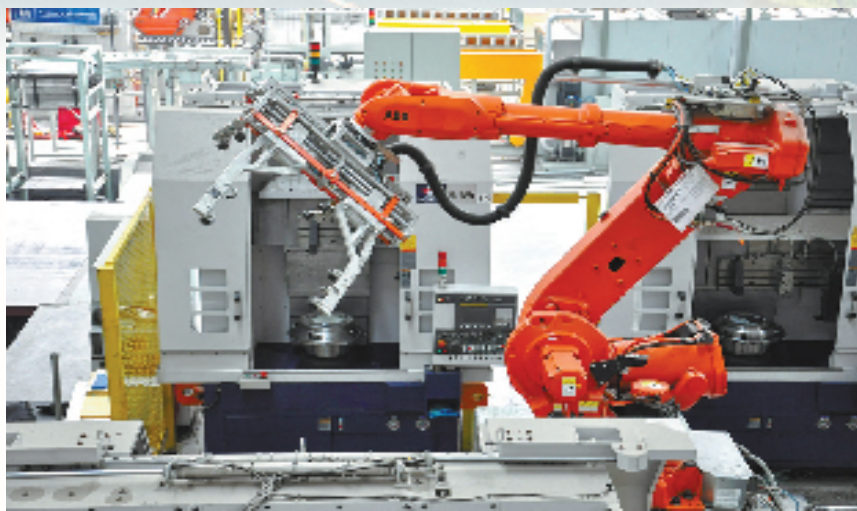
金固公司车轮毂生产线