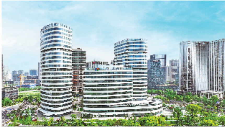
杭州高新区(滨江)“中国数谷”大厦

把目光看向“中国数谷”,这里正以数据要素市场化改革破题。好比把数据搬上“商超货架”,数据确权、定价、交易等环节正逐渐被改革攻克,构建起“三数一链”数据可信流通体系,让数据从无形资产转化为实实在在的经济价值,催生出无数新的商业模式和业态。