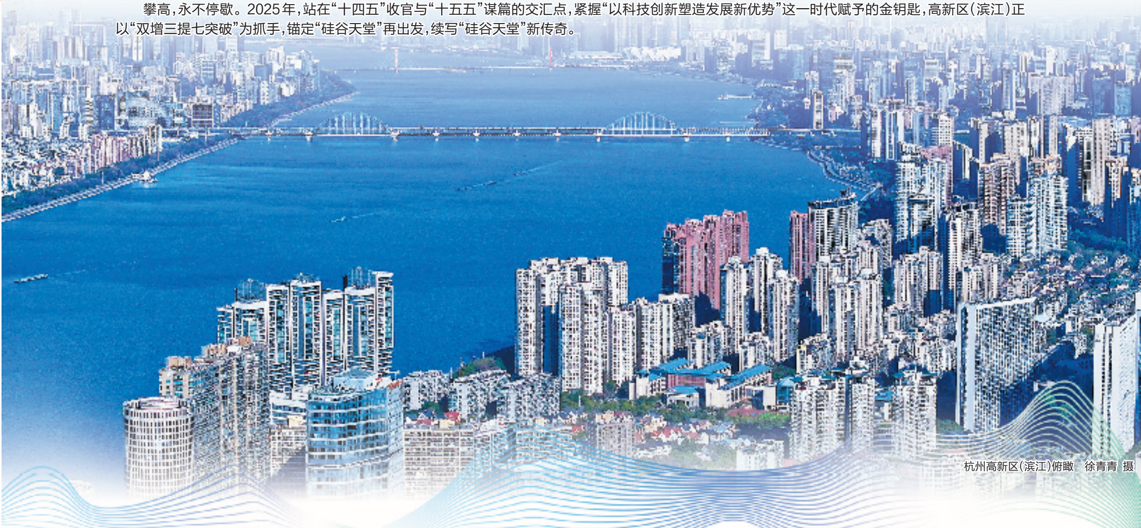
杭州高新区(滨江)俯瞰

攀高,永不停歇。2025年,站在“十四五”收官与“十五五”谋篇的交汇点,紧握“以科技创新塑造发展新优势”这一时代赋予的金钥匙,高新区(滨江)正以“双增三提七突破”为抓手,锚定“硅谷天堂”再出发,续写“硅谷天堂”新传奇。