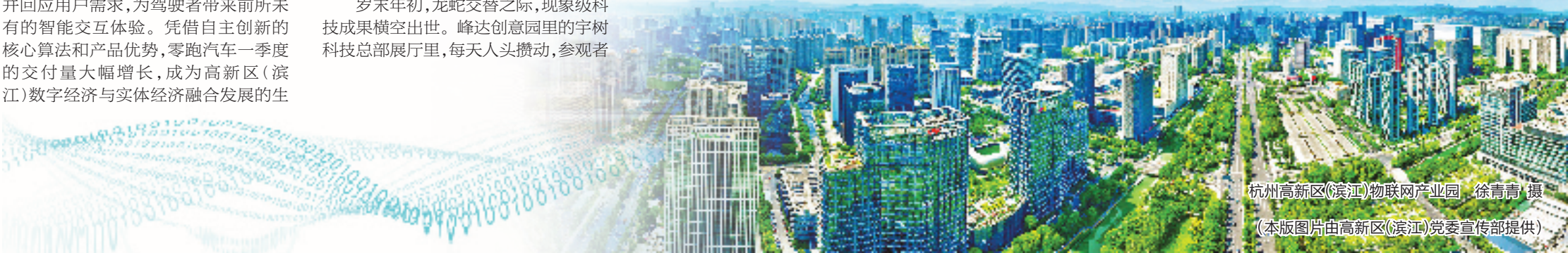
杭州高新区(滨江)物联网产业园