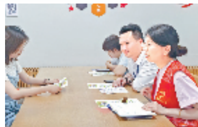
银湖街道高桥社区议事会现场

基层监督是清廉乡村建设的关键。埭溪镇探索“阳光监督”机制，通过健全村级小微权力清单、规范“三资”管理，强化村务公开等方式，确保权力在阳光下运行。各村成立由老党员、村民代表组成的“廉情监督队”，对村级工程、惠民补贴等事项全程跟踪，发现问题及时反馈整改。在莫家栅村，村监会每月召开“阳光议事会”，将村级财务收支、项目进展等事项向村民“晒账本”，接受群众质询；贯边村通过“村民说事”平台，收集群众对村干部履职情况的意见建议，形成“群众点题、干部答题、纪委监督”的闭环机制。这种“人人参与监督”的模式，有效提升了群众满意度。 如今的埭溪镇，清廉之风正转化为发展实效。村庄环境愈发秀美宜人，干群关系愈加紧密融洽，特色产业愈发蓬勃兴旺，美妆小镇日益成为创新创业的热土。清廉建设带来的不仅是风气的转变，更是群众福祉的提升以及实实在在的发展成效。未来，埭溪镇将继续深化清廉乡村建设，以廉洁文化赋能乡村振兴。