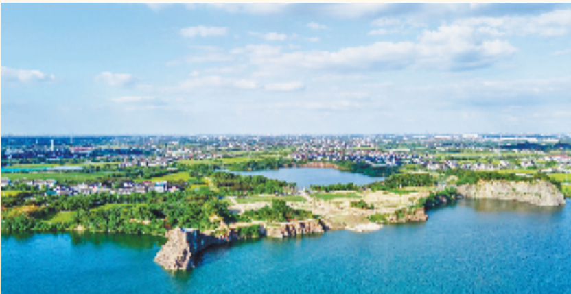
风景如画的神仙湖

花溪河水蜿蜒流淌，在袁花镇武侠路上，一座白墙黛瓦的江南民居——金庸故居坐落于此。自金庸故居开放以来，来自四面八方的金庸迷络绎不绝，故居广场前熙熙攘攘，热闹非凡。 袁花镇自古以来文化底蕴深厚、风光秀美，更是金庸先生的家乡。对于袁花镇来说，文旅产业招商是关键一环。 “作为金庸故里，我们有一张金字