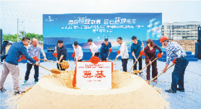
袁花镇重点项目开工

这个“五一”假期，武侠文学大师金庸的故乡嘉兴海宁市袁花镇很是热闹。据相关统计，全镇累计接待游客20万人次，单日接待游客量近4万人次，创历史新高。其中，神仙湖生态公园表现尤为亮眼，单日游客量突破2万人次；金庸故居接待游客1.4万人次，展现出“金庸故里”的文化吸引力。 漫步神仙湖，碧波荡漾，新一批文旅项目稳步落地；行至金庸故居，毗邻的龙山文化产业园建设正酣；走进阳光科技双百产业园，企业赶订单、忙生产，机器的轰鸣声奏响发展强音……今年，袁花镇专门成立招商局，吹响新一年招商引资新号角，掀起项目落地新热潮，真正以招商引资“开门红”推动“海宁东部重镇”再创新辉煌。