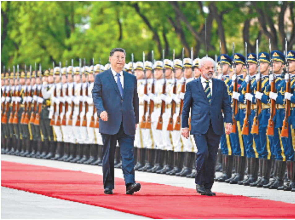
5月13日下午，国家主席习近平在北京人民大会堂同来华进行国事访问的巴西总统卢拉举行会谈。这是会谈前，习近平在人民大会堂东门外广场为卢拉举行欢迎仪式。

习近平强调，站在新的历史起点，中巴双方要坚持战略互信，夯实中巴命运共同体根基，秉持相互尊重、互利共赢的优良传统，在涉及对方核心利益和重大关切问题上相互支持，加强各层级、全方位往来，确保双边关系长期健康稳定发展。要坚持扩大合作，丰富中巴命运共同体内涵，深化“一带一路”倡议同巴西发展战略有效对接，发挥好两国各项合作机制作用，加强基础设施、农业、能源等传统领域合作，拓展能源转型、航空航天、数字经济、人工智能等合作新疆