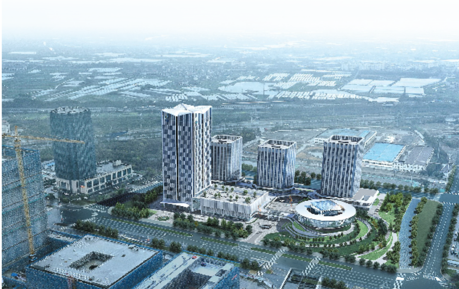
上虞“智创青春谷”(产业驱动芯项目)效果图

作为长三角一体化发展国家战略的重要支点，浙江曹娥江经济开发区(简称“曹娥江开发区”)以弄潮儿的姿态，锚定具身智能新赛道，借力杭州湾具身智能创新中心这一战略载体，在传统制造与未来科技的交汇处开辟新航道，全力推动传统产业向智能化、高端化转型，打造长三角数智经济的新高地。这里，不仅是机器人“手眼通明”的试验场，更是“人工智能+”产业生态的孵化器，一场以智变推动质变的产业升级大戏已然拉开帷幕。