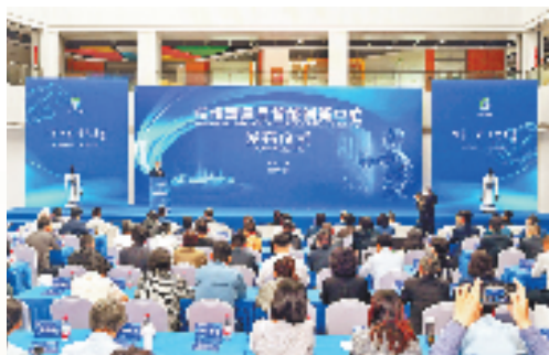
4月9日，杭州湾具身智能创新中心成立。

在杭州湾畔的产业版图上，曹娥江开发区始终涌动着敢为人先的基因。当科技革命进入具身智能新纪元，曹娥江开发区敏锐捕捉到机器人从“感知智能”向“行动智能”进化的时代信号。面对全球科技产业的迅猛发展，曹娥江开发区紧跟国家战略步伐，将具身智能纳入区域产业发展的核心赛道。自2024年以来，开发区以前瞻性的眼光和务实的举措，全力抢占具身智能产业的风口。