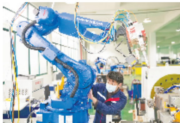
位于上虞区东关街道万里创业园内的浙江创新激光设备有限公司，工人正在研制智能化焊接机器人。

同时，开发区还通过引进安全硬盘基地、液冷产业中心、数字相控阵雷达等储备项目，形成“人工智能+”的产业生态。这些项目的落地实施，将为开发区产业升级提供强有力的支撑和保障。