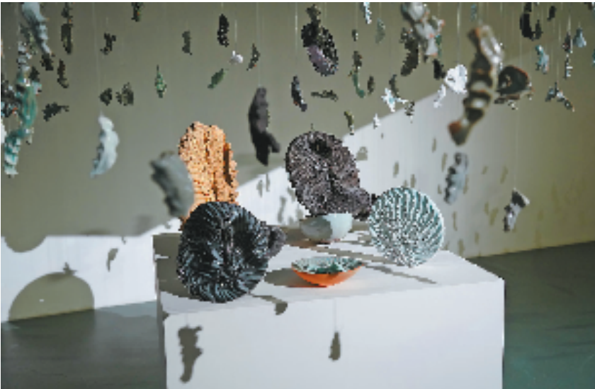
美国陶艺家马克·卢索尔德的艺术作品《龙泉》。

青年力量无疑是非遗传承的“破壁者”。共创活动现场,95后非遗技艺演示代表叶丹沁感慨:“这些国际艺术大师对色彩、线条的敏锐感知,让我意识到青瓷艺术的表达空间远不止于传统器型。”