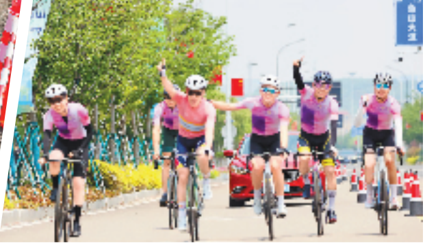
5月11日上午9时,“星辰大海·骑聚岱山”2025岱山骑游大会鸣枪开赛,900名骑手“骑”聚岱山,共同体验这场骑行盛宴。 本报记者 郑元丹 通讯员 邱巧燕 祝波 文摄