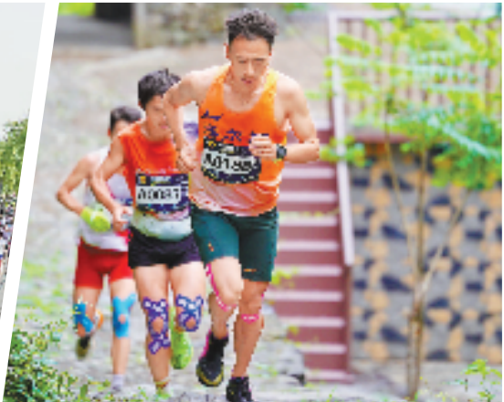
5月11日,以“稽山望越,登峰向远”为主题的2025全国登山挑战赛(会稽山站)在绍兴市柯桥区稽东镇启幕。900余名来自全国各地的选手齐聚于此,用速度感知自然之美。这是首个在会稽山脉间举办的国家级登山赛事。 本报记者 徐添城 共享联盟·柯桥 沈潇 通讯员 王伟峰 文摄