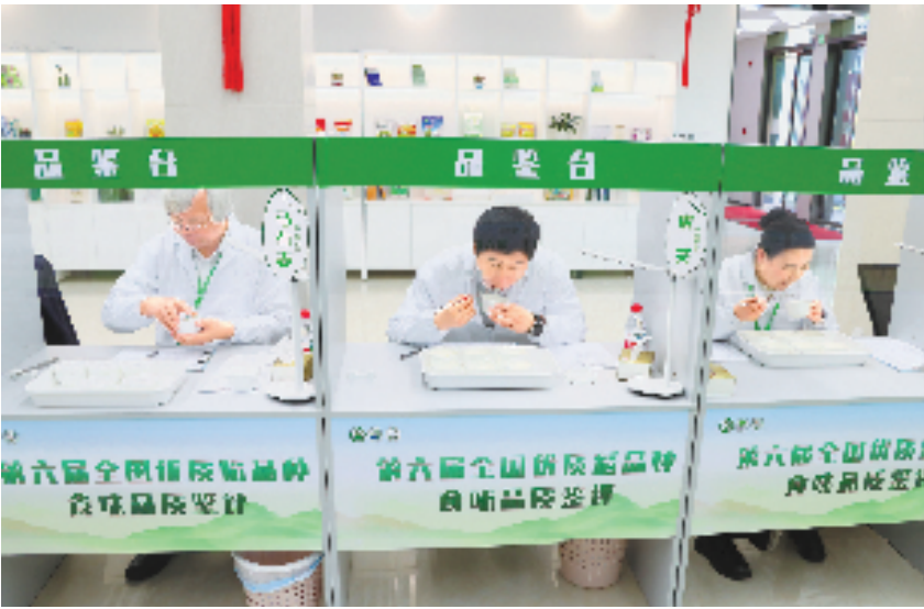
全国优质稻品种食味品质鉴评专家评审现场,专家们正在细品打分。

分别由中国工程院院士万建民、中国科学院院士谢华安领衔,成员包括国内水稻知名专家、省级行业管理专家等。