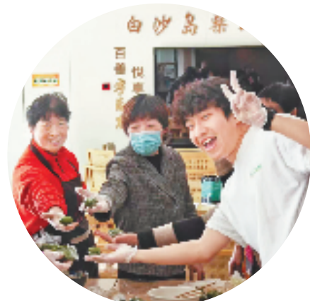
“守望时光里”海岛支老公益项目每月策划特色主题活动,图为清明期间,舟山普陀区柴山岛志愿者与老人共同制作200余枚手工青团。

随着老龄化程度的持续加深,老年群体对医疗、康复、慢病管理等健康服务的需求也在持续攀升。省政协委员许江晨认为,要扩大老年医学科覆盖率,支持建立“老年医学研究院”,开展心血管等老化病防治技术攻关;健全分级诊疗机制,以县域医共体为依托,采取定期体检等方式及时筛查健康风险,为基层老年人提供便利的医疗服务。