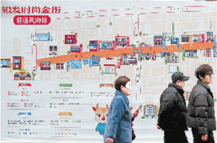
杭州上城区“银发时尚金街”

省政协调研组前期在舟山走访时了解到,当地约七成的60岁以上老人分散居住在53个岛屿上,如何破解海岛养老难题,是这些年舟山民生工作寻求重点突破的方向之一。位于普陀