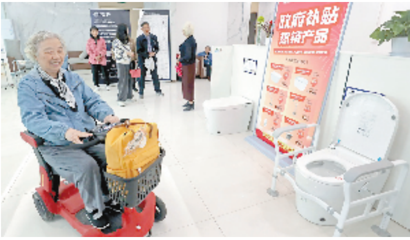
在杭州西湖区古荡街道华星社区健康馆内,居民正在参观体验适老化产品。

桑榆未晚,钱塘潮涌——站在万亿级市场的起跑线上,浙江正以银发经济集聚高地为引擎,以政策与创新双轮驱动,在康养旅居的山水画卷里、在生命科技的前沿阵地上,书写银发经济高质量发展的浙江答卷。