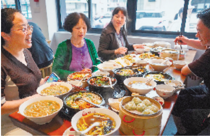
在嵊州小吃旗舰店,游客在享用美食。