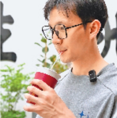
游客在处州生生堂饮用中药奶茶。

产业,全国已有嵊州小吃门店3万余家,从业者超过8万人。当地还举办小吃文化旅游节,繁荣“夜间经济”。“通过打造旗舰店,让更多人了解嵊州小吃和美食文化。”嵊州市商业集团相关负责人说。