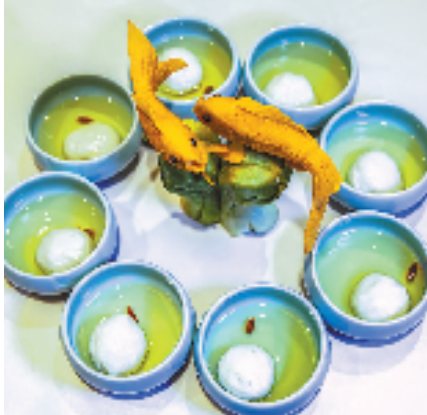
图为南浔区菱湖镇“百鱼宴”中的状元球。