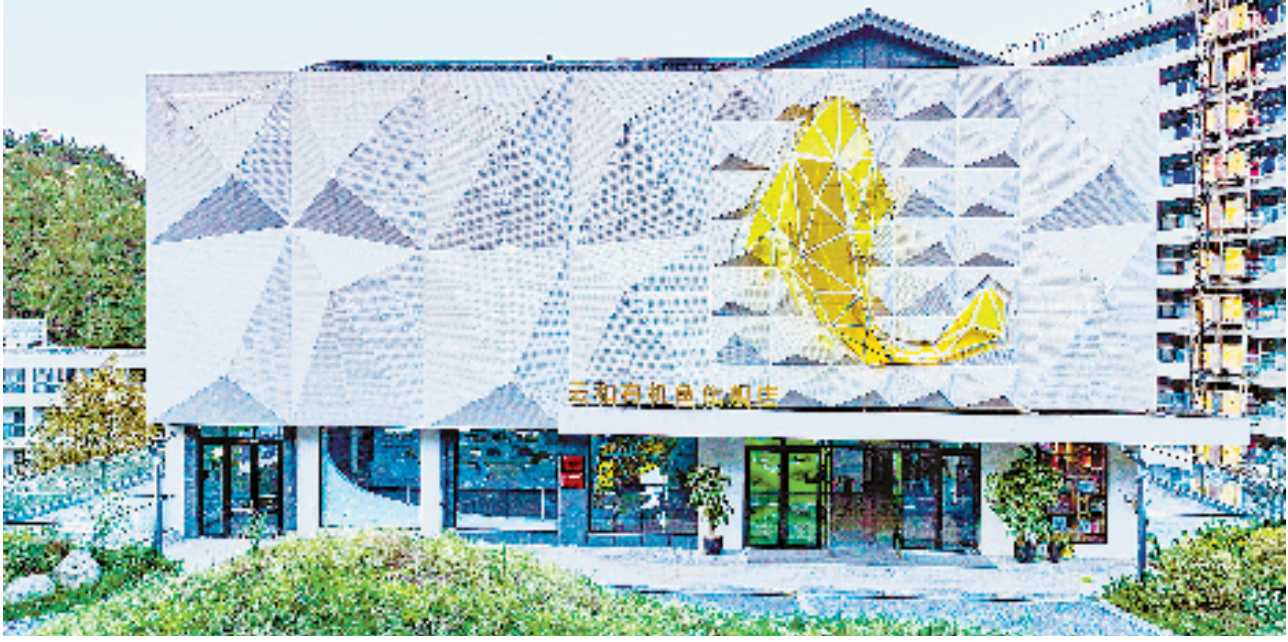
图为云和有机鱼旗舰店。