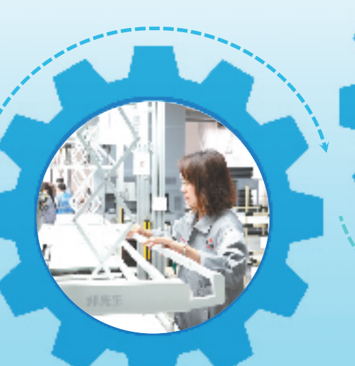
浙江好易点科技股份有限公司车间内，工人正在组装智能家居产品吸油烟机。