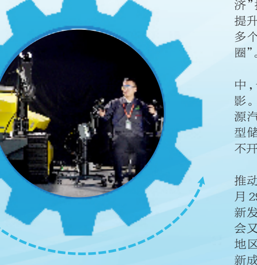
浙江凯富博科技有限公司，工程师操纵液压机械臂实现人机协作。