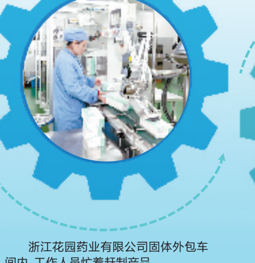
浙江花园药业有限公司固体外包车间内，工作人员忙着赶制产品。