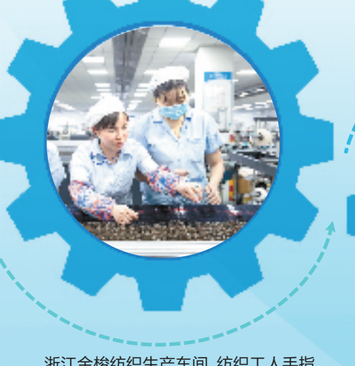
浙江金梭纺织生产车间，纺织工人手指翻飞间完成一系列工作。