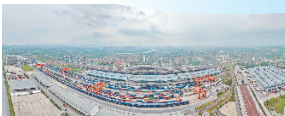
铁路金华南货场，浙江中欧班列和高铁联运班列满载进出，推动国际贸易发展。

金华市农科院和企业建立的人才互聘共享共用机制，就是教育科技人才体制机制一体改革方面的探索。该机制由金华市农科院选派拥有丰富实