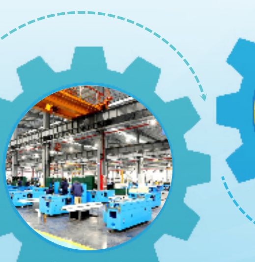
浙江杭机股份有限公司程控机床装配区，工人忙着导轨刮研工作。