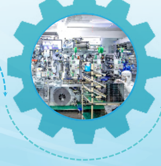
浙江钲威能源科技有限公司生产车间，一条条自动化生产线有序运转，锂离子电池源源不断下线。