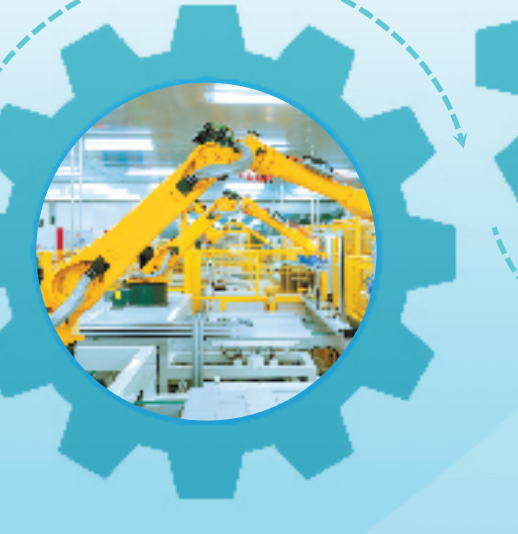
模店东磁生产车间。