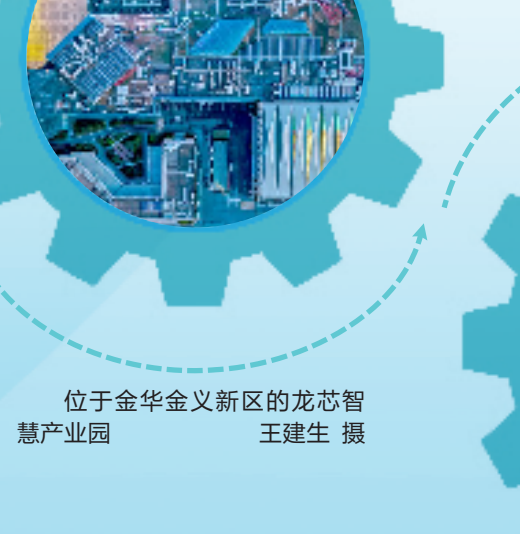
位于金华金义新区的龙芯智慧产业园