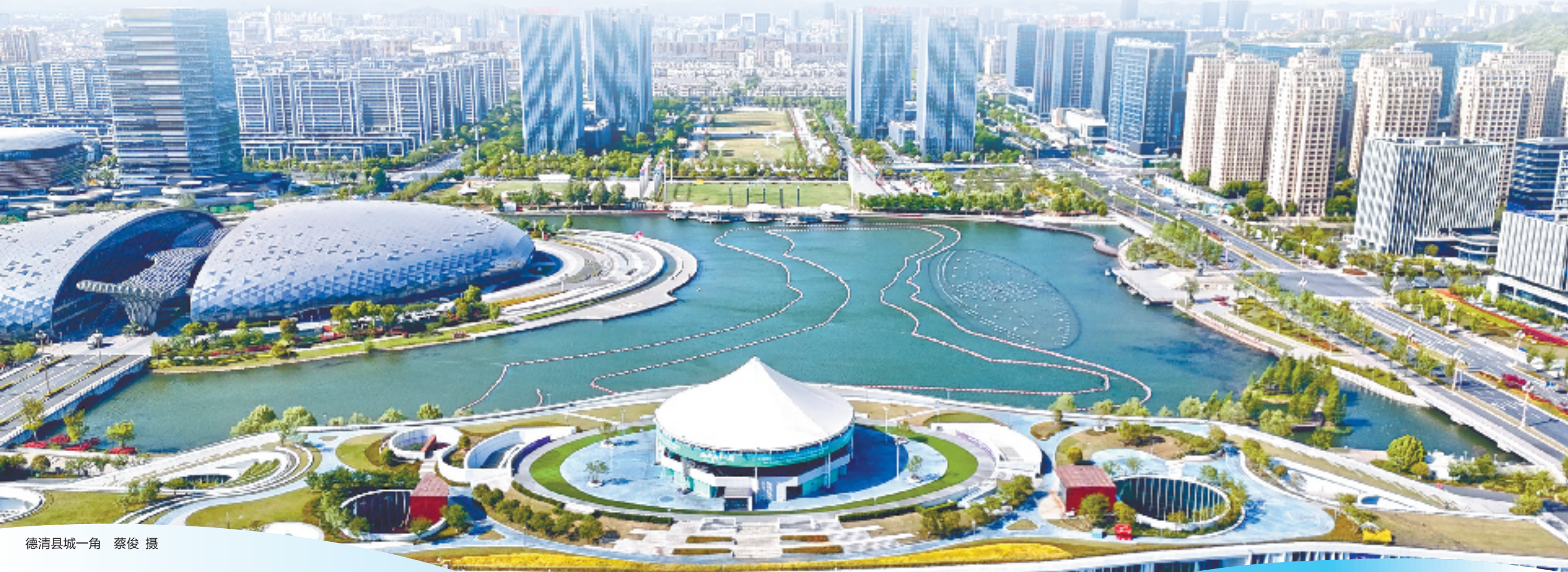
德清县城一角

在传承与变革中寻找“让心度假”的答案，当前，德清正以兼收并蓄的国际视野和开放胸怀，探索文旅融合发展新方向。