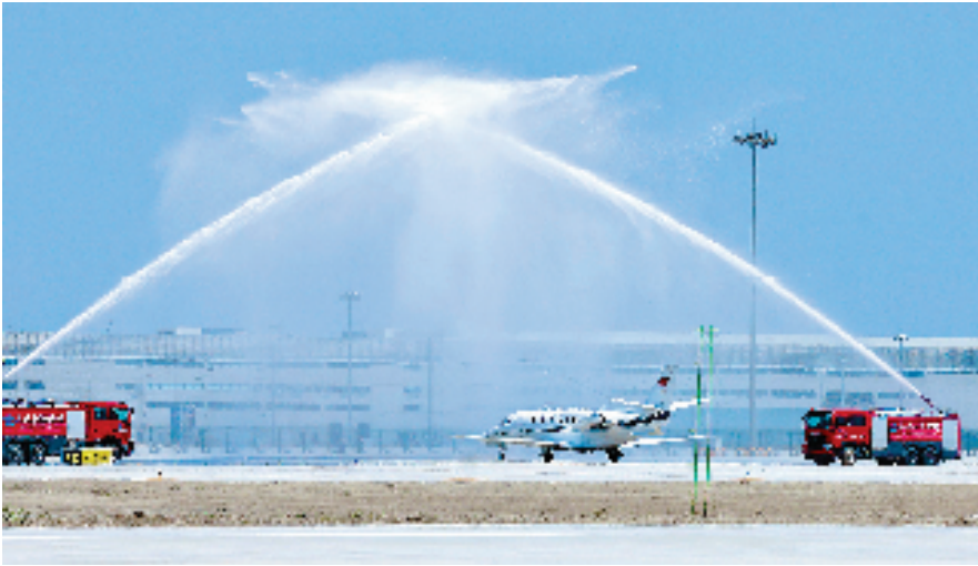
4月15日，随着一架印有“中国民用航空局”字样的校验飞机平稳降落在机场跑道，嘉兴南湖机场正式启动校飞工作。校飞工作预计为期7天（具体视天气情况而定）。图为嘉兴南湖机场以民航界最高礼仪“过水门”仪式为校验飞机“接风洗尘”。