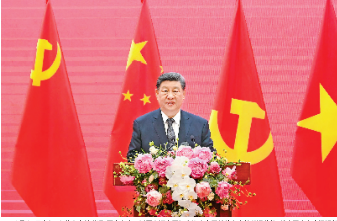
4月15日上午，中共中央总书记、国家主席习近平在河内国际会议中心同越共中央总书记苏林、越南国家主席梁强共同会见中越人民大联欢活动代表。这是习近平发表题为《奏响睦邻友好主旋律 共谱命运与共新篇章》的致辞。

习近平强调，中越友好在两国人民守望相助中生根发芽，两国人民在争取国家独立和民族解放的正义事业中并肩战斗，给“同志加兄弟”的深厚情谊印染了鲜红底色。中越友好在两国人民团结协作中开花结果，双方锚定“六个更”总体目标，坚定支持彼此走符合本国国情的社会主义道路，不断取得社会主义建设事业新成就。中越友好在两国人民共同追求中传承升华，双方积极践行全球发展倡议、全球安全倡议、全球文明倡议，坚定捍卫国际公平正义，始终坚定站在历史正确一边、时代进步一边，为亚洲