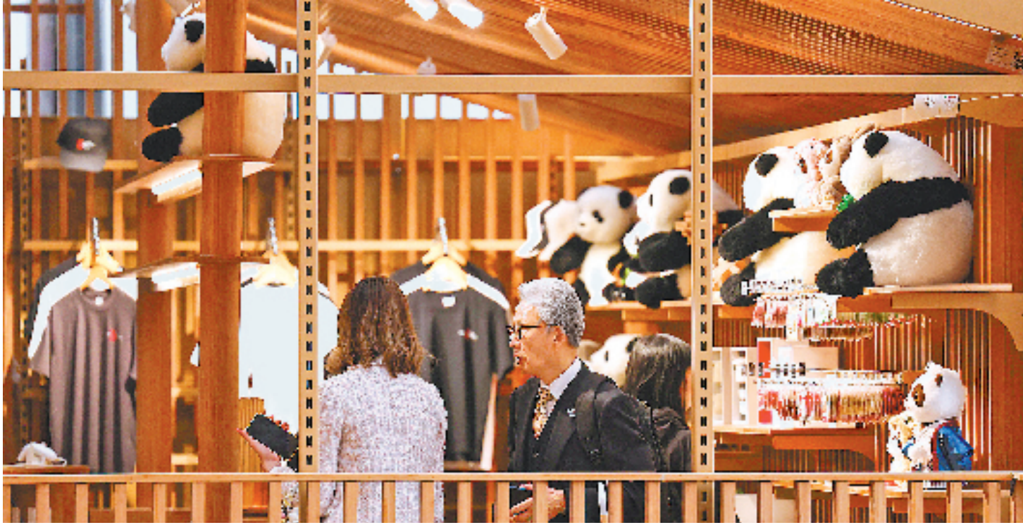
4月13日,参观者在中国馆的纪念品商店内选购。