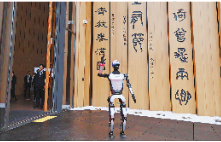
4月13日,人形机器人在中国馆外向嘉宾招手致意。