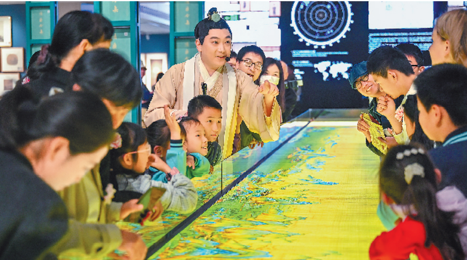
4月13日，“宋画大展·春日游园会”在位于杭州良渚的历代绘画大系典藏馆举行，不少观众身着汉服、手持灯笼，沉浸式体验宋代风雅，共赴一场穿越盛