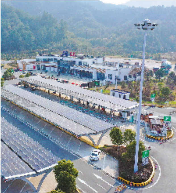
零碳改造后的次坞高速服务区，在充电站屋顶铺设光伏板，房

屋边建设小型风力发电机，实现绿电自发自用。通讯员 刘广扩 摄 本报讯（记者 胡静涛 通讯员 黄琳 江航 李志浩）4月11日，经零碳改造后的次坞高速服务区投运，这也是浙江首个智慧零碳供能高速服务区。据了解，改造项目包括建设风电、光伏装机1.39兆瓦，研发应用智慧零碳供能系统，通过为新能源汽车和服务区运行提供绿色电力，每年预计减少碳排放约583吨。