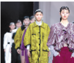
许村本土时尚服装品牌亮相时装周

从织机轰鸣的家纺重镇,到设计驱动的时尚高地,当前的许村镇,正以“许村国际时尚中心”的新身份,以“许村设计”诠释着“中国时尚”,让世界看见中国时尚的无限可能。