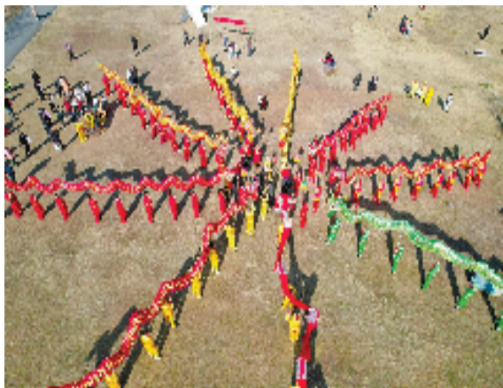
九龙聚首闹元宵,欢度非遗莲都年。