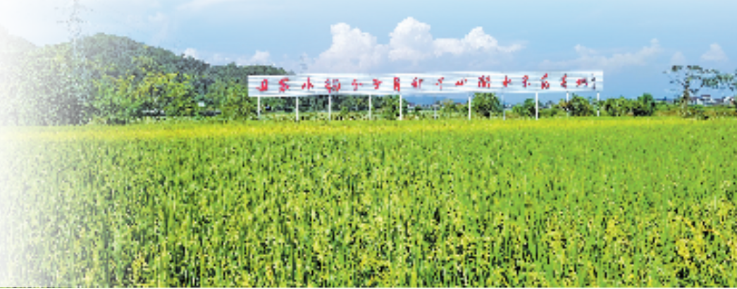
碧湖镇魏村村的稻田里矗立着袁隆平院士亲笔题写的“国家水稻分子育种中心丽水示范基地”一行大字。

创新驱动不是选择题,而是高质量发展的必答题。去年,莲都区本级国家高新技术企业和省级科技型中小企业总数均较三年前翻了一番,省级高新技术企业研发中心新增数相当于过去三年的总和。新的一年,莲都还将强化教科人融合集成发展,完善“产业定位科技、科技索引人才、人才依靠教育、教育赋能产业”的创新生态链,不断催生新动能的增长点。