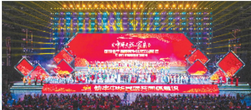
景宁畲族自治县成立40周年县庆