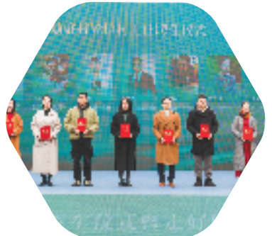
走马塘村“轮值村主任”聘任现场

截至目前，宁波市“轮值村主任”帮助引进项目超90个、带动投资金额3.1亿元，开展服务村民活动1500余次，帮助销售农产品5800余万元，慰问捐赠价值超过340万元，有力助推乡村共同富裕事业发展。