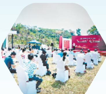
“初心之旅”多党合作精品研学线路发布活动现场

如何做好民主党派新成员发展工作？早在2018年，金华市就开始了民主党派新成员“初心强化”工程的探索。经过6年实践积累，“初心强化”工程已从发展培养新成员的“小切口”模式演变为推动多党合作事业高质量发展“大提升”的重要抓手。