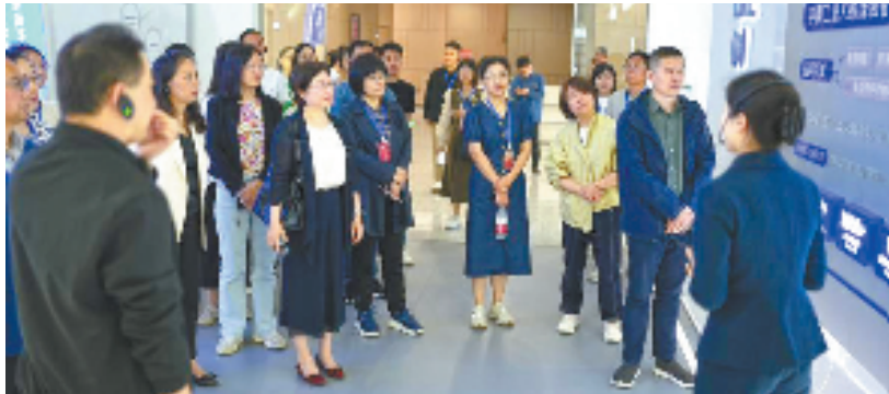
重点课题调研和专项民主监督专题培训班现场教学活动

来，嘉兴市委统战部围绕高品质民生供给、智造创新强市、中心城区首位度提升等主题每年开展专题学习培训，