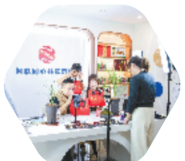
2024年11月，全省新的社会阶层人士统战工作实践创新基地（同心荟）规范化建设推进会在绍兴召开，与会人士现场参观网联会直播活动。

站在新起点，绍兴市委统战部将进一步提高站位、加大力度，努力把“同心荟”建设成为凝聚人心和汇聚力量同频共振、工作覆盖和组织覆盖互促互融、平台建设和效能建设亮点纷呈的创新载体。