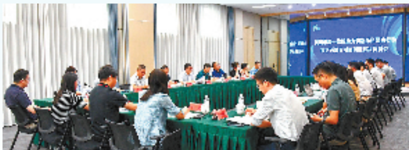
2024年8月，杭州市统一战线助力创新深化建功行动市区两级面对面问题解决协调会在钱塘区举行。

2024年，杭州充分发挥党外代表人士科学家、民营企业家的主体作用，围绕生物医药产业，深化“新知新