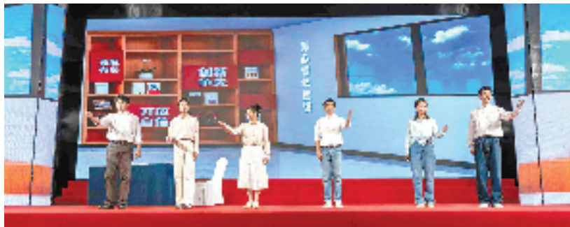
2024年11月1日，在衢州市统一战线经典展示活动上，6名同心青年宣讲员作题为《挺膺担当 奋斗有我》的宣讲。