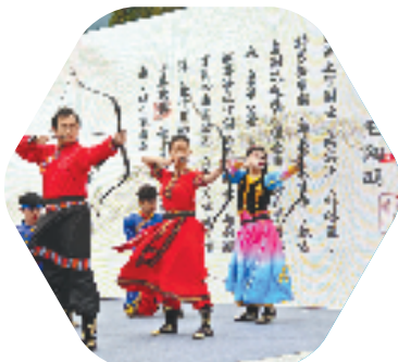
定海新建村“56同心园”举行全国无瞄弓乡射大赛

近年来，舟山统一战线积极发挥“党外代表人士+”作用，形成“连片打造+产业融合+强链富民”集群共富模式，扎实推进“同心共富”市域实践。