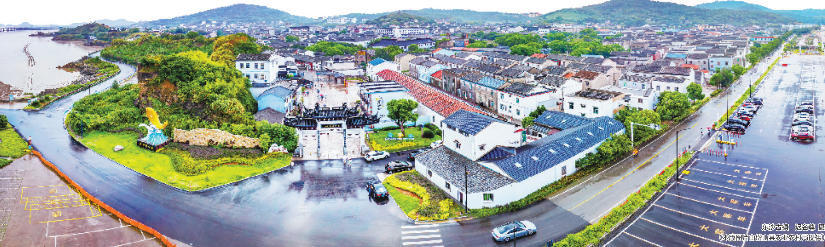
东沙古镇

在岱山,越来越多的小岛和乡村,不仅拥有“诗和远方”的浪漫,也写满了百姓生活的幸福点滴。