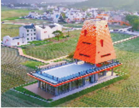
龙头-鹿栏晴沙综合体

岱山不仅做足点上精品村,还按“一带一主题”的要求,打破乡镇、行政村界限,将各具特色的乡镇、行政村、渔农业产业项目串联,打造美丽乡村特色示范带。