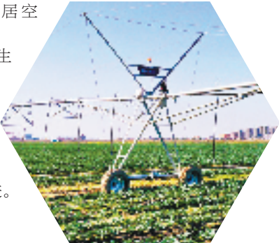
岱山现代农业产业园插上“数字化”翅膀