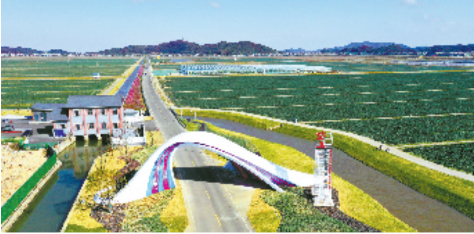
岱山现代农业产业园