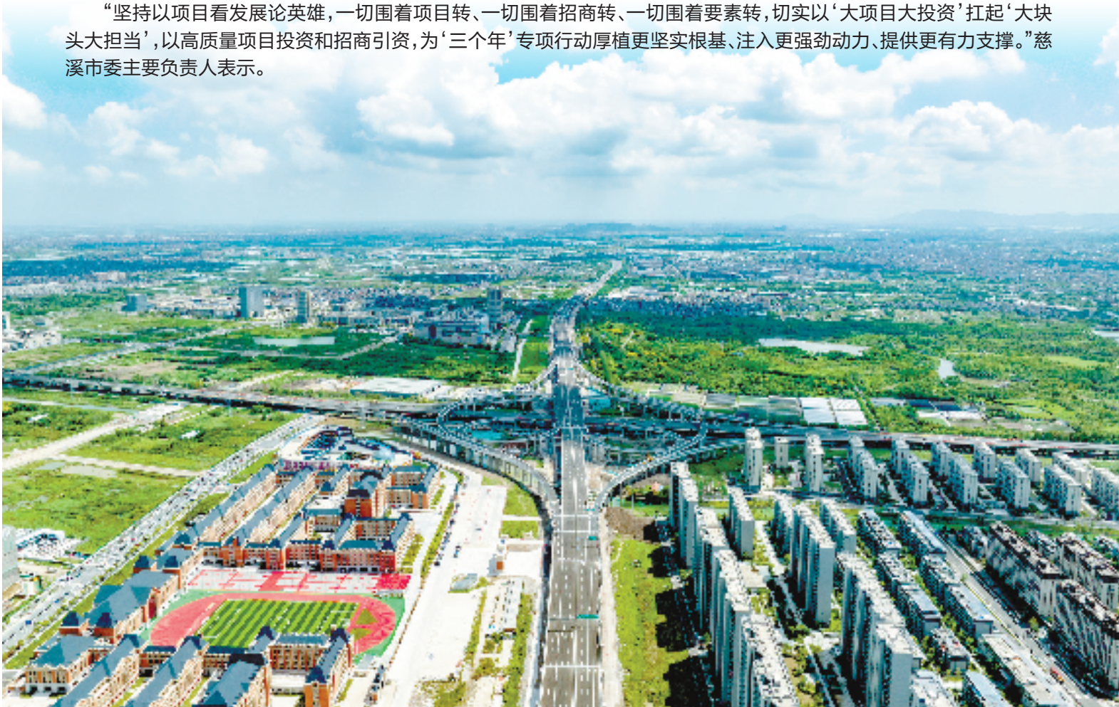
慈溪中横线快速路一期

“坚持以项目看发展论英雄，一切围着项目转、一切围着招商转、一切围着要素转，切实以‘大项目大投资’扛起‘大块头大担当’，以高质量项目投资和招商引资，为‘三个年’专项行动厚植更坚实根基、注入更强劲动力、提供更有力量支撑。”慈溪市委主要负责人表示。