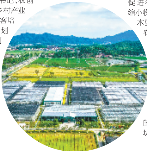
萧山谢经安·传化农创村