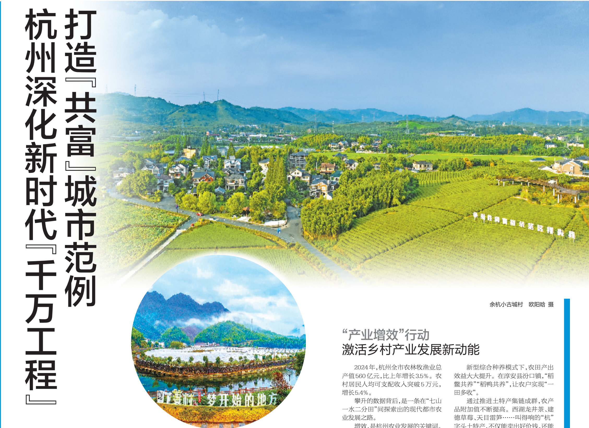
余杭小古城村

左手繁华都市,右手富美乡村。杭州将全力以赴,切实将省市决策部署加快转化为共同富裕的美好现实。