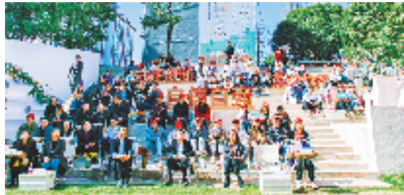
龙游籍大学生招募“引才大使”和“职场探路者”活动

一批批重大产业性项目的落地，一位位优秀人才的引进，壮大了龙游特色产业集群，激活了人才科创的“一池春水”，撑起了龙游县高质量发展的“四梁八柱”。