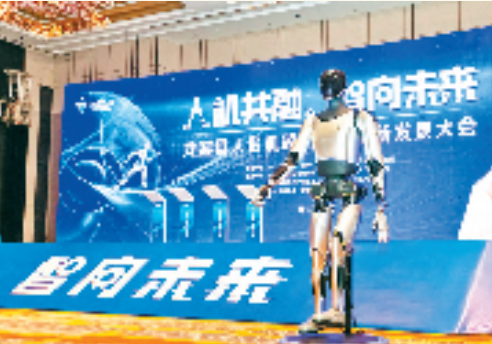
首个“龙游产”通用型人形机器人——“YOLO”游龙01

信和智造产业园、瑞兴绿色新材料产业园等项目建设热火朝天，搭建高端装备制造和新材料行业孵化基地，提升园区产业承载力；富民小微园、机器人产业园等标准化厂房，以“拎包入住”吸引中小企业集聚孵化；工业“120”急修服务平台为企业提供延伸智能化整改、生产线工艺改造等增值化服务；浙西南大宗物资进口仓配交易中心、云墨碳谷孵化园、泰和天街等项目陆续落地，一批生产性生活性功能配套设施项目加快推进……夯实了重大平台这一“硬支撑”，龙游县这片干事创业的沃土充分释放高质量发展的“强磁力”。