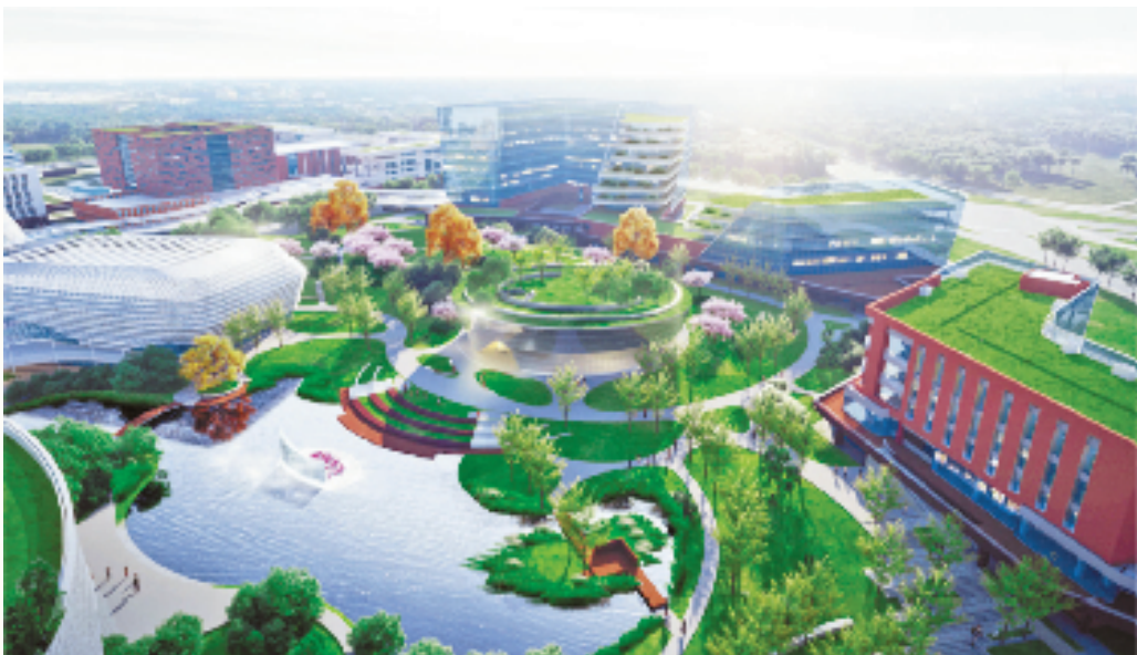
浙工大生态工业创新研究院效果图