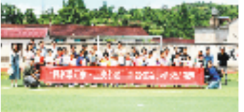
“福彩暖万家·点亮梦想”探访慰问活动

2024年累计减免21516例，减免金额超2200万元，同时进一步规范遗体接运殡仪服务、提升殡葬服务场所环境等措施，有效提升了殡葬服务的品质和水平，开发推广浙里办——绍兴数智殡应用，实现了殡葬服务的智能化、便捷化。