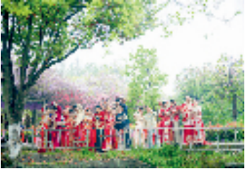
特色集体婚礼 倡导婚恋新风

随着社会的不断进步和文明程度的提升，殡葬改革作为推动社会文明进步、建设社会主义精神文明的重要举措，正逐步深入人心。绍兴民政通过群众“身后事”基本服务项目减免政策扩标提面，