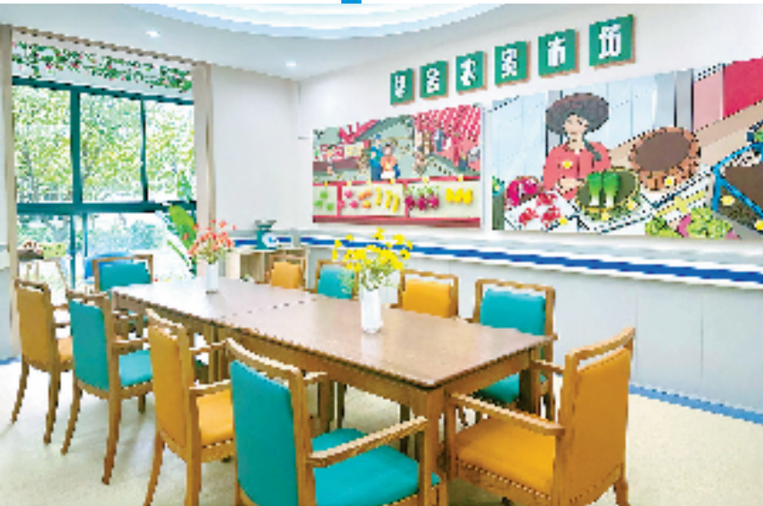
柯桥区华舍金色年华养老服务中心认知障碍照护专区