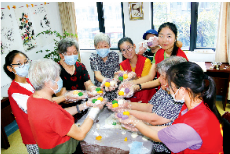
多元养老服务可感可及

2024年以来，绍兴市民政局以“越享民生”工作品牌为牵引，在养老服务体系建设、社会救助、社会福利、社会事务等方面取得了显著成效，民生福祉持续绽放光彩，古城绍兴注入了新的活力与温情。