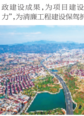
义东高速南市至南马段

监督不用跑”,从源头防范廉洁风险的发生。 值得一提的是,除了将各类监督贯穿项目建设始终外,浙高建公司还坚持落实文化倡廉、教育促廉、实地悟廉、家风助廉等一系列清廉文化建设举措,目前“金衢严道”“义路阳光”等清廉品牌已落地生根,“清廉之花”遍开项目建设全过程,形成了人人要廉洁、懂廉洁、会廉洁的良好氛围。 接下来,浙高建公司将继续秉承打造“工程优质、员工优秀、资金安全”阳光工程,以“1+1>2”的高质量党风廉