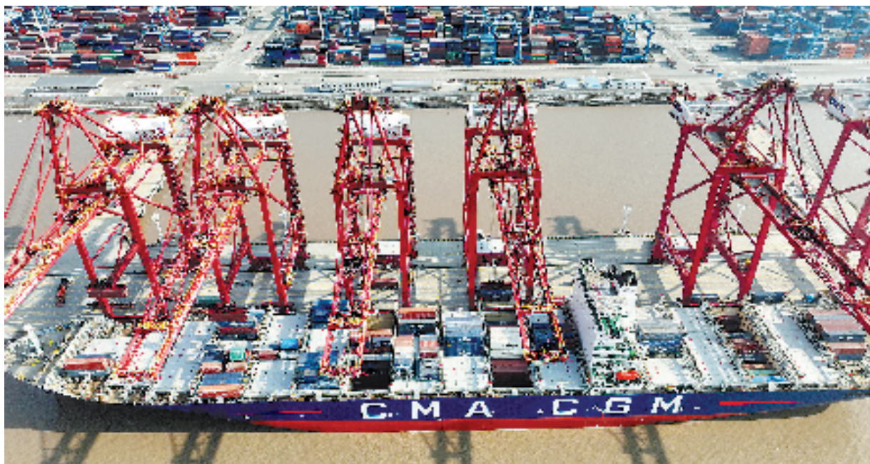
1月4日，宁波舟山港金塘港区大浦口集装箱码头车来船往，一片繁忙景象。