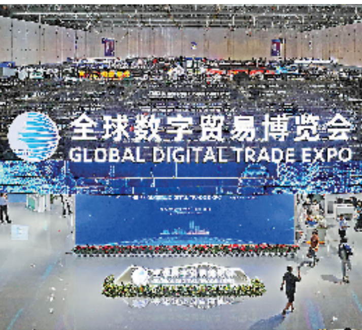
第三全球数字贸易博览会中国馆展区。

无论是顺势而为，抑或迎难而上，代表委员们坚信，浙江推进高水平对外开放、建设高能级开放强省是扬优势、增动能，到世界市场的汪洋大海中去游泳，在大海中经风雨、见世面，在游泳中学会游泳。