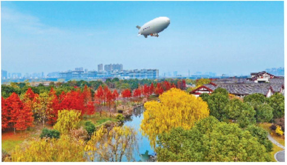
2024年12月25日,游客乘坐飞艇在绍兴运河上空观光。