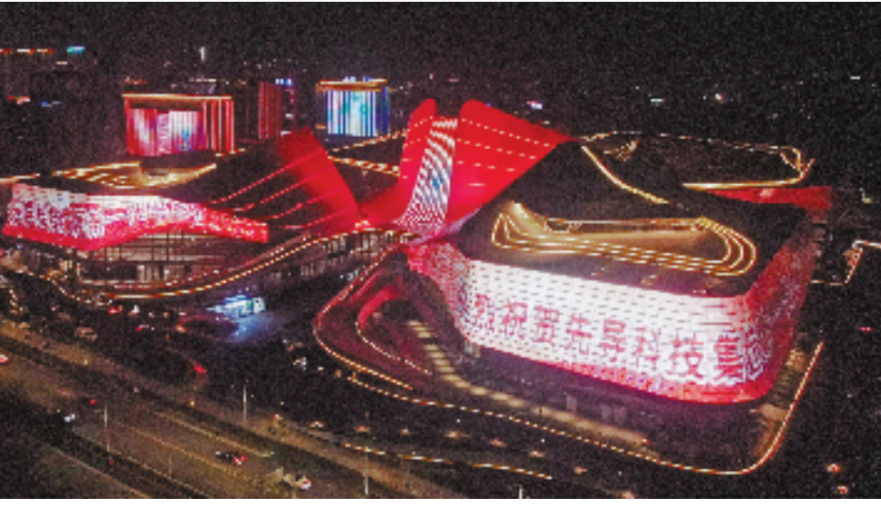
1月3日晚,衢州为“先导科技集团新一代半导体材料及器件生产基地项目投产”亮灯。

全身”的重大改革,迈入攻坚阶段。改革大招,也是改革实招。“落到实处、取得实效”,一个“实”字是浙江这批硬改革的鲜明特点。顺应新趋势、新要求、新期待,改革不停步,浙江更值得相信。