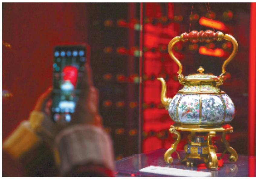
图为“故宫·茶世界”展览上将展出的铜胎画珐琅开光山水花鸟图八棱提梁壶。

一叶见方寸,一茶现万千。新年伊始,故宫博物院与浙江省博物馆携手推出一场穿越古今的茶约:“故宫·茶世界”观茶——茶文化精品文物展。