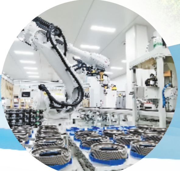
玉环企业车间内,机械手在加工产品。