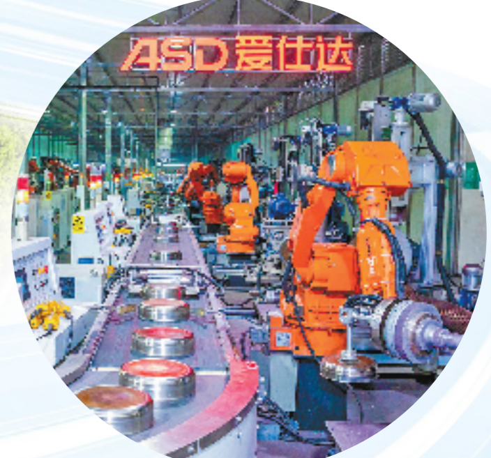
温岭企业的智能生产线