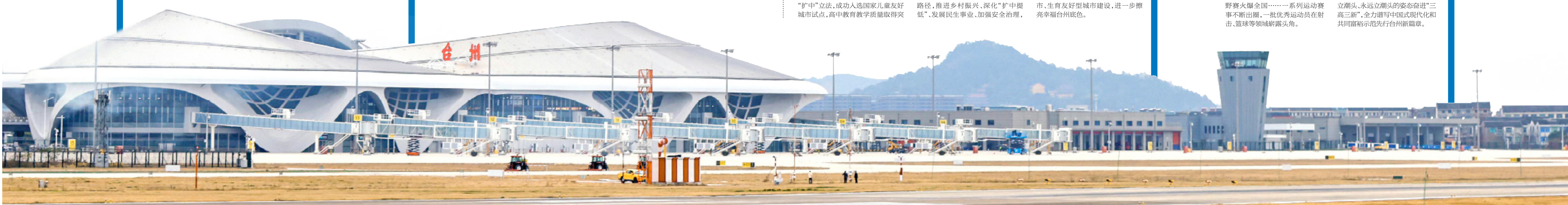
台州路桥机场