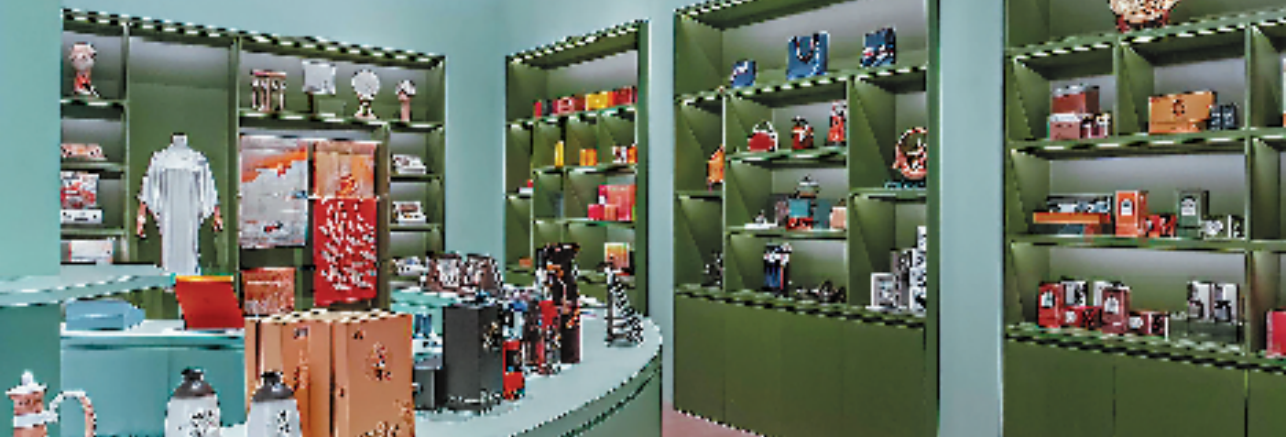
图为在杭州萧山国际机场集中展示活动区展览的产品。