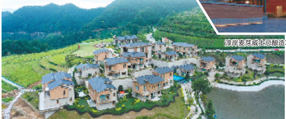
淳安麦芽威士忌酿造项目