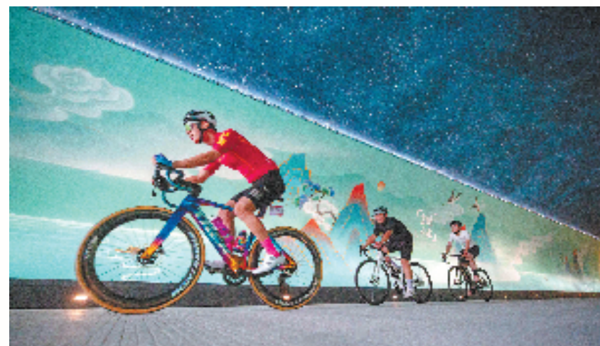
自行车爱好者骑过千岛湖隧道艺术馆

时至今日,淳安绿色发展的赛道日益清晰——2022年以来,淳安将产业体系细分成健康水业、全域旅游、普惠林业、现代农业和生态敏感产业的“4+1”体系,点绿成“金”,淳安好山好水好空气的资源优势,正不断转化为产业发展优势。